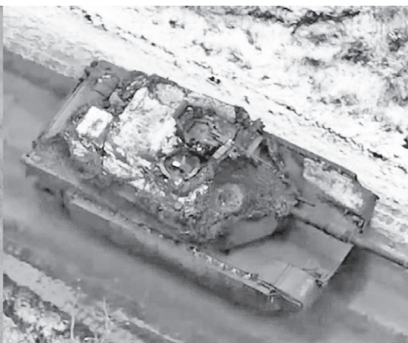
Американские танки Abrams оказались не «самыми лучшими в мире»

наши бойцы и заверили, что все переданные ВСУ танки Abrams будут гореть: «В этом можно даже не сомневаться».