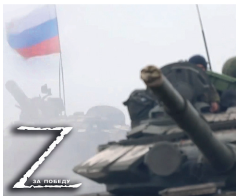
Специальная военная операция