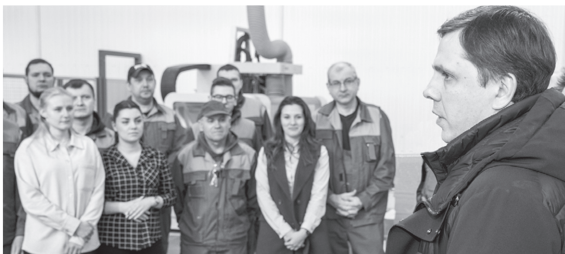
Встреча губернатора с коллективом предприятия