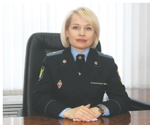
Приостановить взыскание Исполнительные производства в отношении участников СВО подлежат приостановлению