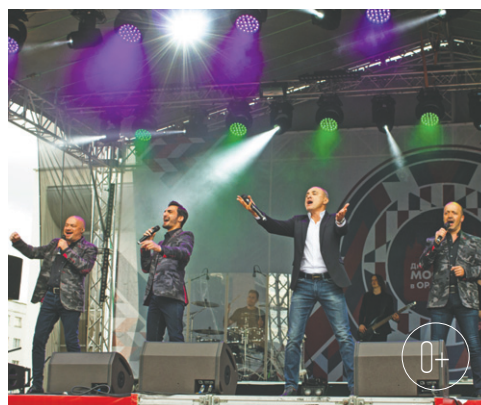
Хор Турецкого спойт в Орле Благотворительный концерт популярной группы пройдёт 14 марта