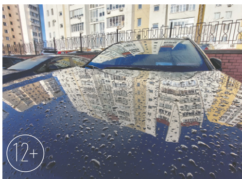
Отражения, игра света и тени — в этом красота и философия мира

ку, но иногда хочется сделать работу в чёрно-белом цвете, свет и тень порой выигрышно смотрятся именно в чёрно-белом варианте, — говорит он. — У меня выработалась привычка замечать эти «фрагменты» окружающей среды, про-