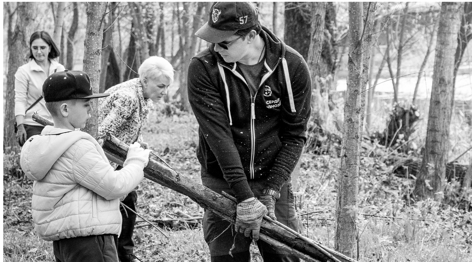
Чисто не там, где убирают, а там, где не мусорят

В прошедшую субботу тысячи жителей Орла и области приняли участие в уборке улиц, дворов, парков, скверов и других территорий