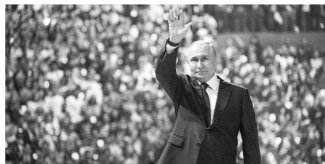
ВСЕМИРНЫЙ. МОЛОДЁЖНЫЙ. ТВОЙ! Стр. 2