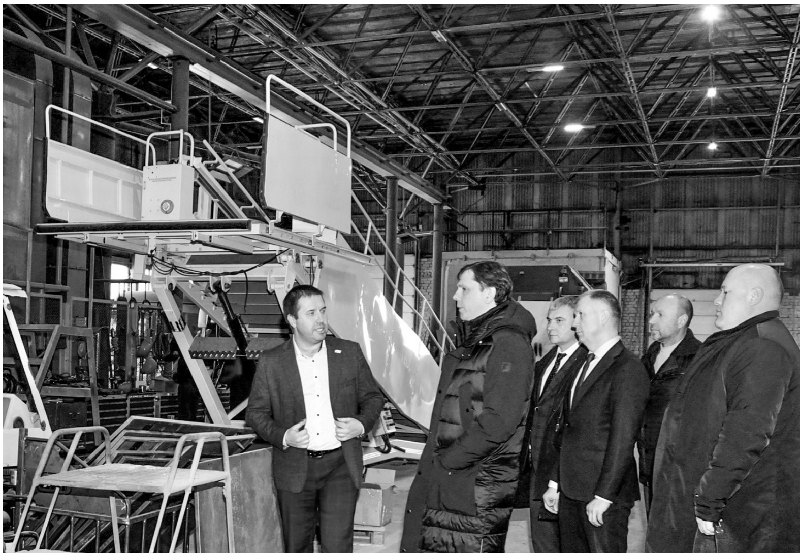
Мценский литейный завод — одно из самых современно оснащённых предприятий в России и СНГ

Среди главных мер, которые дадут нашей экономике импульс развития, в Послании Федеральному собранию Президент России назвал государственные инвестиции в производство. 300 миллиардов рублей дополнительно направят в Фонд развития промышленности, ещё не менее 200 — через кластерные инвестиционные программы, 120 миллиардов рублей будет выделено в качестве субсидий на проведение научно-исследовательских и опытно-конструкторских работ, а также расширение промышленной ипотеки. Дополнительно построят и модернизируют свыше 10 миллионов квадратных метров производственных площадей. По словам президента, растущие производственные мощности помогут решить приоритетные задачи: рост несырьевого неэнергетического экспорта и увеличение доли отечественных высокотехнологичных товаров и услуг на внутреннем рынке. Орловщина должна внести вклад