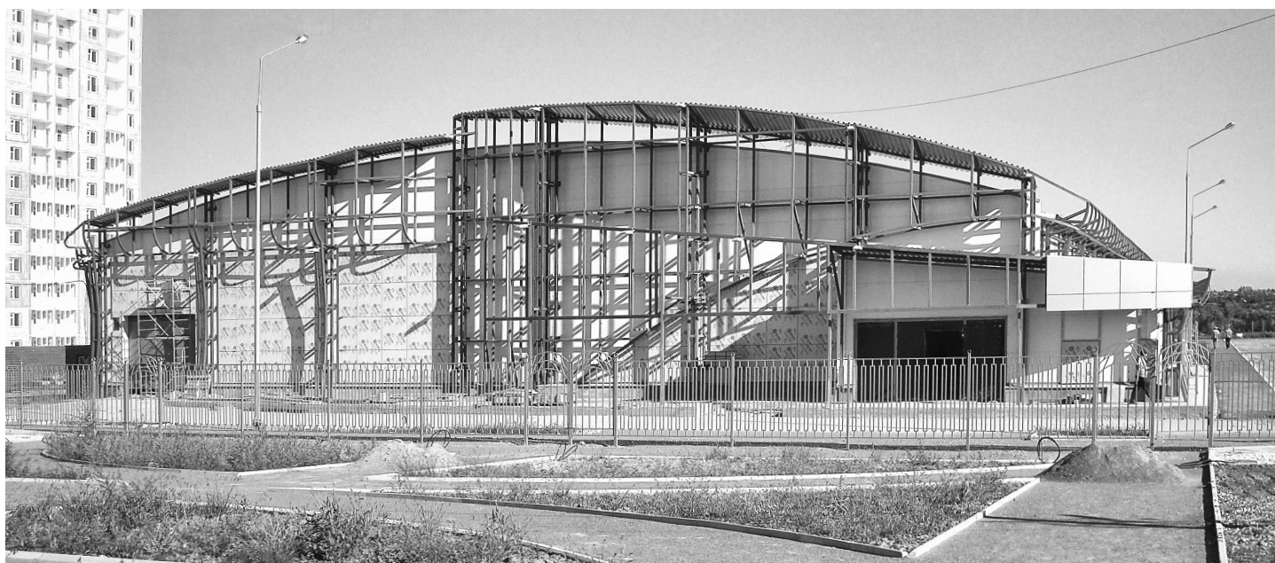
Строительство «Ледовой арены» идёт по графику