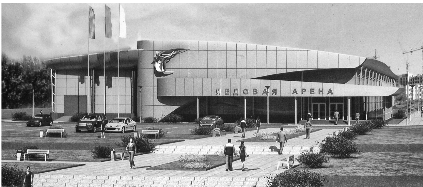
Проект «Ледовой арены» в Заводском районе