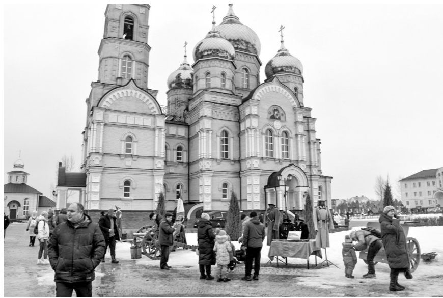
Духовность и единение