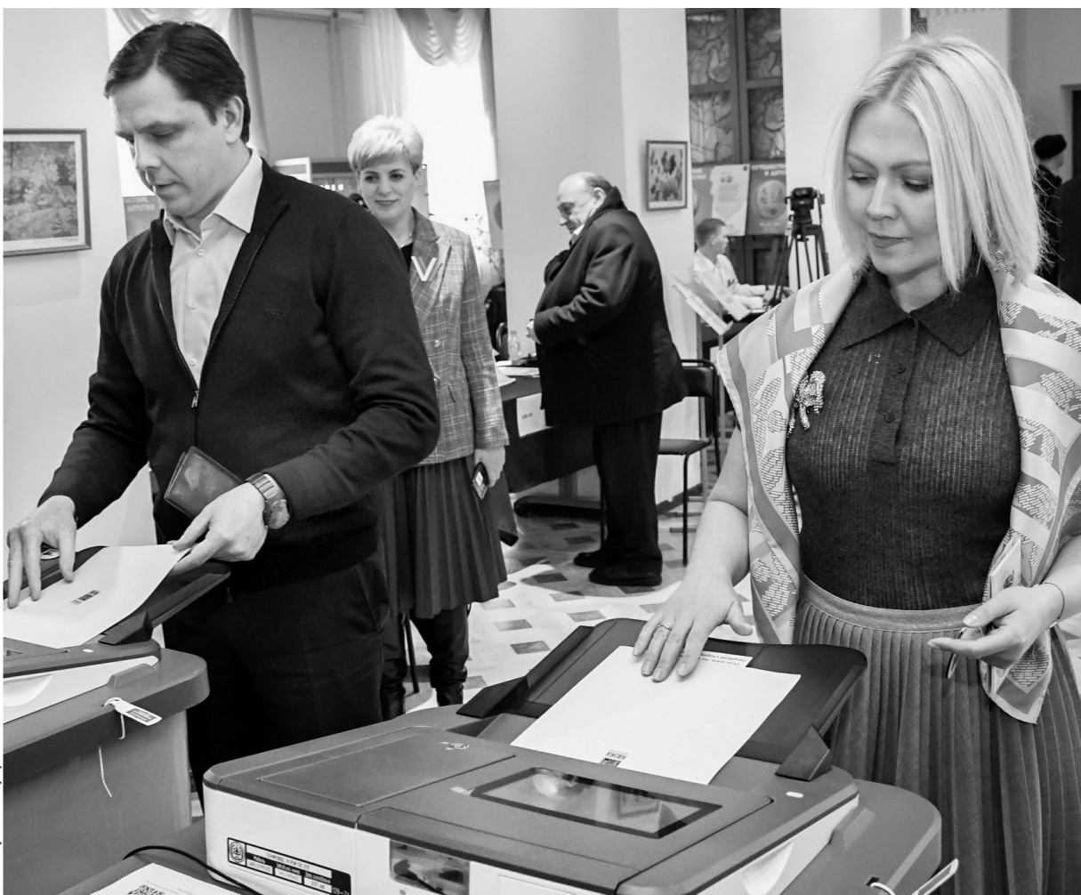
Орловцы проявили активность на главных выборах страны