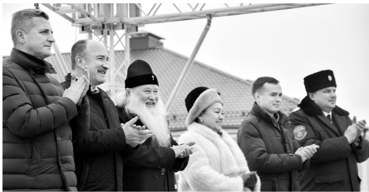
Это наш общий праздник!

С десятилетием воссоединения Крыма с Россией соотечественники поздравили главу Республики Крым Сергей Аксёнов. «Воссоединение Крыма с Россией открыло путь к восстановлению исторической справедливости и единства Русского мира, к возвращению исконных русских земель. Но великие события невозможны без великих личностей — крымская мечта исполнилась благодаря решению нашего президента. Он спас нас от войны и геноцида, постоянно держал руку на пульсе перемен, появились новые больницы, школы, ликвидирована очередь в детские сады, заметно улучшается осязаемая инфраструктура, идёт невиданными темпами благоустройство. Раньше через наши скверы в вечернее время можно было ходить только с олядкой, теперь же там светло, просторно, есть фонтаны, проведено озеленение. Появился новый транспорт — троллейбусы, автобусы. Всего и не перечислить! В общем, преобразование в лучшую сторону произошло во всех сферах. В Крыму проживают представители более 175 национальностей. При администрациях есть отделы