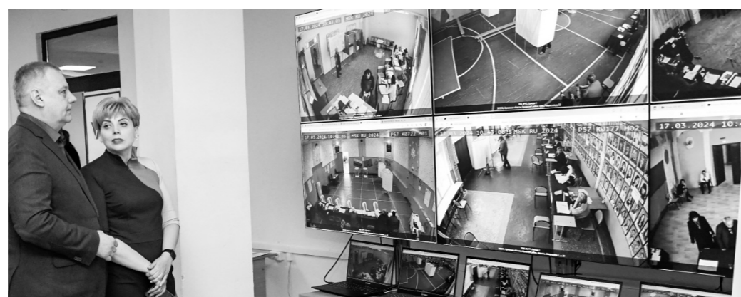
Видеостена в ситуационном центре

По словам Андрея Клычкова, президентские выборы на Орловщине проходят максимально открыто. В регионе работает большой коллектив наблюдателей. Жалоб, которые могли бы поставить под сомнение честность, прозрач-