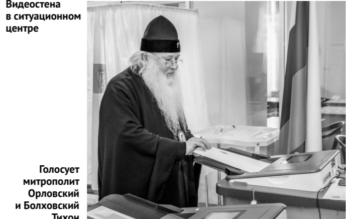
Голосует митрополит Орловский и Болховский Тихон

ность избирательной кампании, не поступало. Особое внимание уделяется обеспечению безопасности голосующих. При этом на избирательных участках создана праздничная атмосфера, проводятся спортивные, семейные мероприятия, организованы масленичные гулянья.