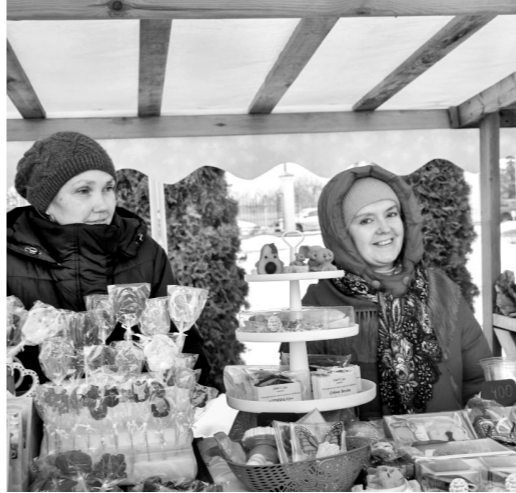
В Вятском Посаде всегда рады гостям!