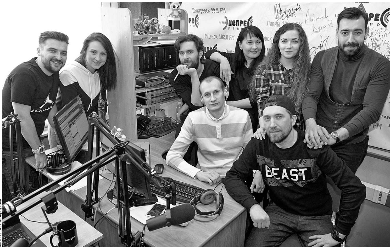
Коллектив «Экспресс радио Орёл»

— А мы продолжаем выполнять ваши музыкальные пожелания, и в следующие несколько минут вы услышите «Кардиограмму» Бориса Гре-