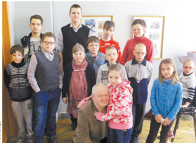
Дети любят рисовать

По признанию Алексея Шевченко, задача иллюстратора — «вытащить» у автора всё то, что он не показал. Все, например, знают, что у Незнайки шляпа яркого цвета — так Носов написал. А какая именно, придумал художник Алексей Лаптев. И после него