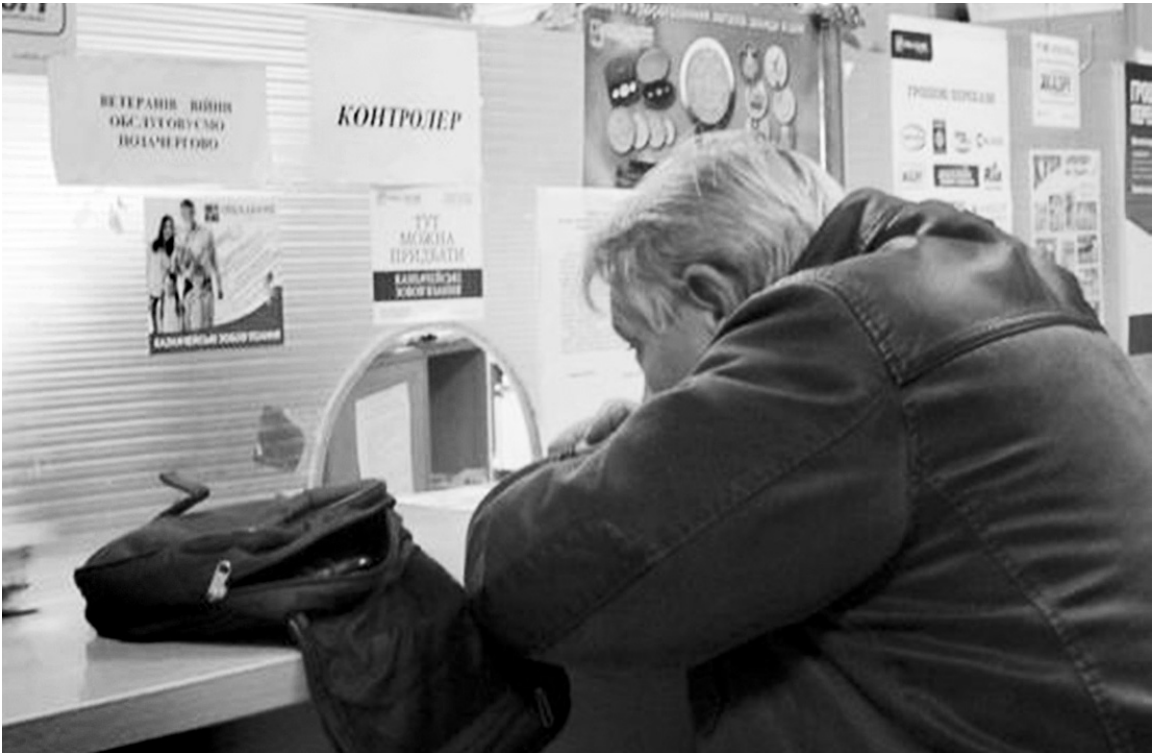
Пожилые люди — самые добросовестные плательщики за ЖКУ