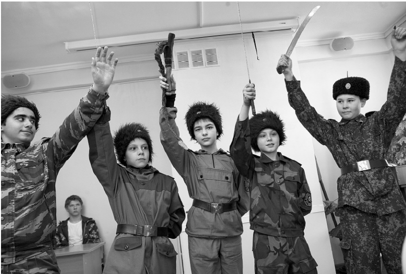
Любо, братцы, любо!