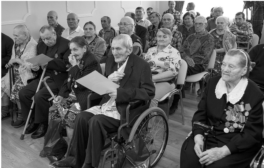
Пенсионеры приняли гостей радушно