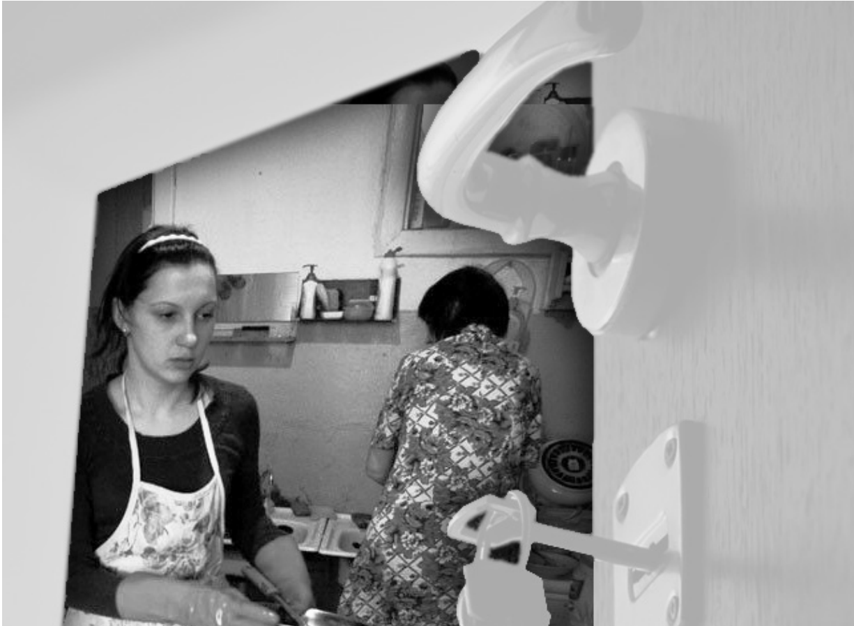
Жизнь женщины-инвалида в коммуналке — ад

Администрация г. Орла уже год не может предоставить женщине-инвалиду положенное ей по закону жильё