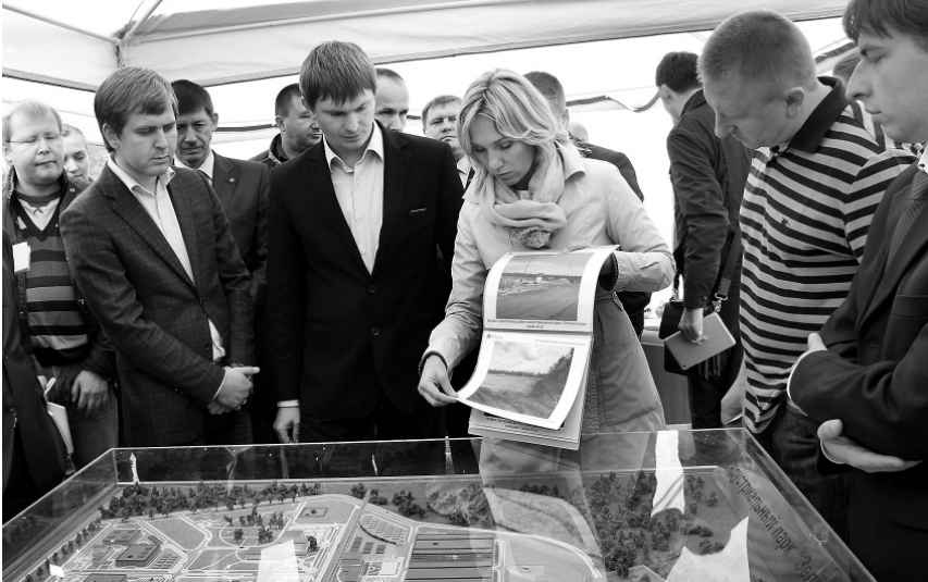
От макета до реализации проекта «Зелёная роща» прошло немного времени

— Дело не в том, плох он или хорош. Давайте вспомним Америку, тот же Детройт, центр автомобилестроения. И что с ним случилось? Теперь это фактически город-призрак. Есть и другие подобные примеры. В Калуге того, слава богу, не произошло,