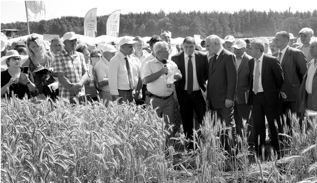
Орловщина давно зарекомендовала себя как житница России

Ещё более 40 тыс. голов вынуждены были утилизировать — то есть практически в некондиционном виде отправить на переработку. Более 500 млн. рублей составили убытки других предприятий в результате нерезализованных, уже заключённых контрактов, когда другие регионы просто отказывались