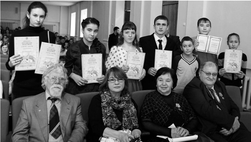
Победители международного конкурса детского изобразительного искусства и члены жюри

Во время праздника юных художников 17 декабря 220 ре-