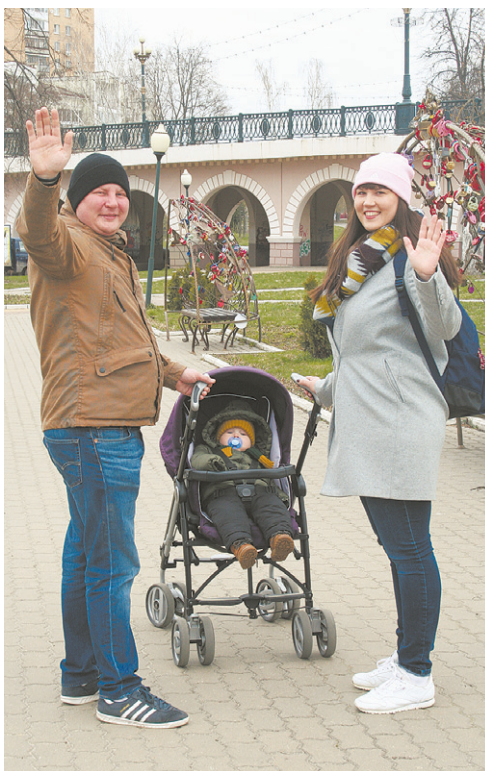
Посаженные рябинки украсят аллею Любви