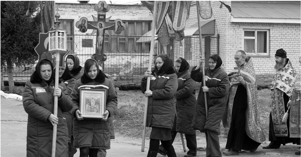
«Воскресение Христово видевши» — такие слова древнего песнопения звучали во время крестного хода