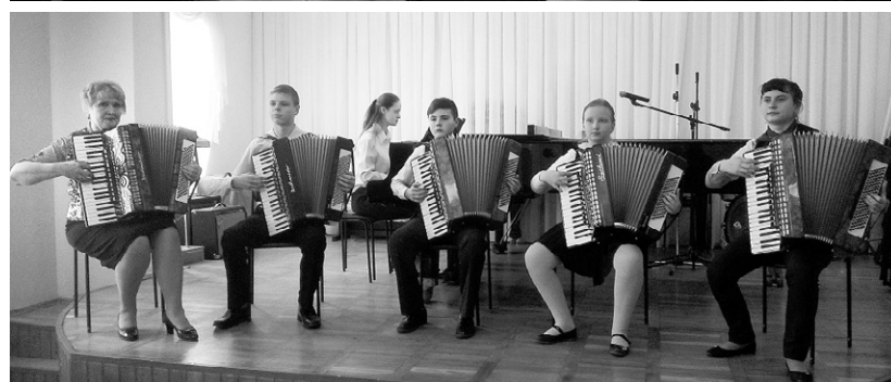
Юные музыканты из Орла — лауреаты III степени конкурса