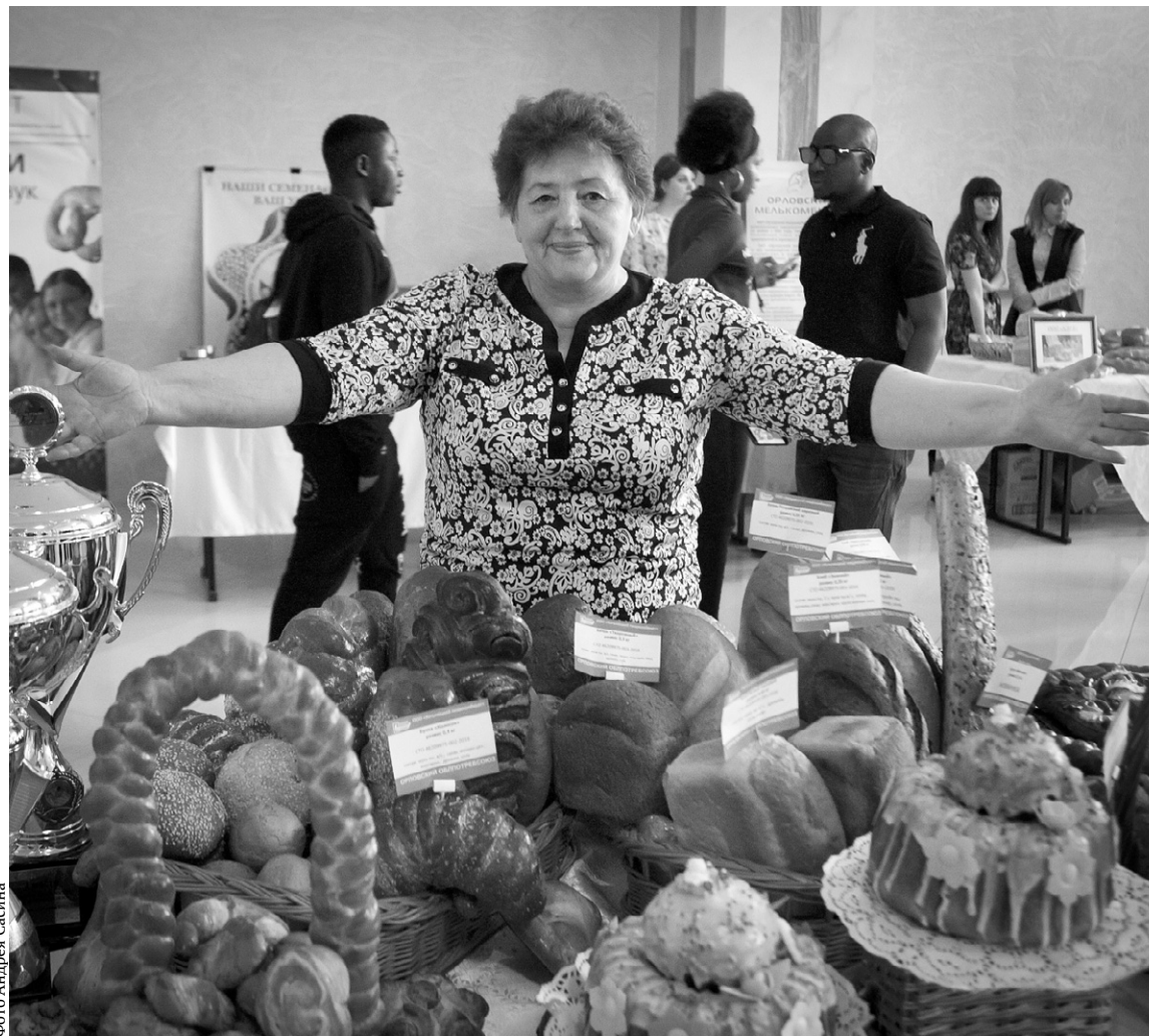
Хлебосольная Орловщина славится своим гостеприимством

— Придумали и испекли её буквально вечером накануне праздника, — смеёт-