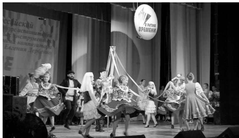
Хореографический ансамбль «Жемчужинки» украсил фестиваль

Конкурсанты выступали в нескольких номинациях: «Баян, аккордеон», «Гармонь», «Домра, балалайка, гитара», а также «Смешанные или однородные дуэты», «Дуэт: учитель — ученик», «Ансамбль русских народных инструментов» и «Оркестр русских народных инструментов». Прослушивания проходили по воз-