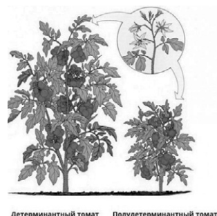
Детерминантный томат Полуиндетерминантный томат

— Понятие «детерминантные» обозначает сорта с ограниченным биологическими факторами (генетически) ростом растения. Как правило, это низкорослые или среднерослые сорта с ранним типом плодоношения, предназначенные для выращивания в открытом грунте или под простейшими плёночными укрытиями. Такие сорта обычно не требуют опоры.