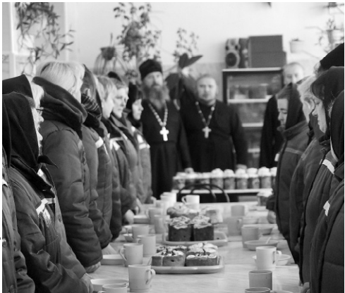
Пасхальная трапеза в столовой

рят на «Христос воскрес»: «Воистину воскрес!».