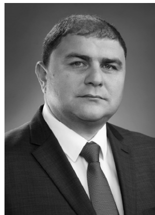
Вадим Потомский, губернатор Орловской области:

— День хлеба в Орловской области — значимое мероприятие, основная цель которого привлечь внимание на перспективы развития отрасли, показать востребованность профессии хлебопека. Хлебопечение необходимо превратить в современный мощный бизнес, отвечающий самым высоким требованиям, прежде всего в отношении качества производимой продукции.