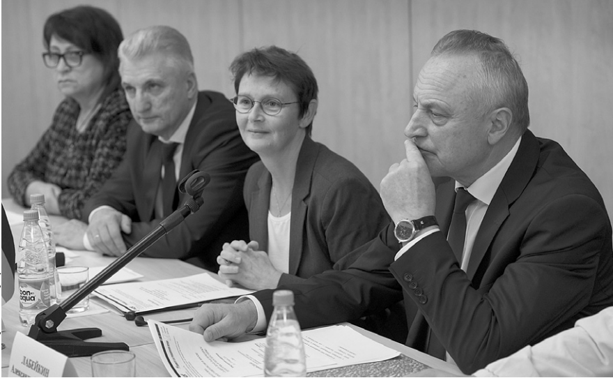
Немецкие коллеги высоко оценили наработки орловского омбузмана