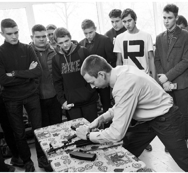
Умение разбирать и собирать автомат пригодится в армии