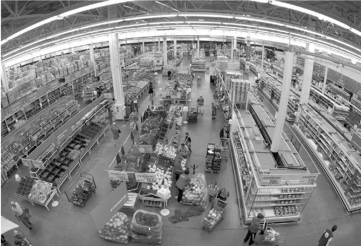
Полки ломятся от изобилия продуктов, но все ли они полезные?

— За текущий год специалистами нашего управления исследовано более 12 тысяч проб пищевой продукции. По микробиологическим показателям чаще всего не соответствуют нормам молочная продукция и кулинарные изделия. Выявлялось повышение нитратов в овощах. Также в этом году обнаружено незначительное количество продуктов, в которых содержался бензопирен (канцероген, способствующий возникновению злокачественных опухолей. — Прим. авт. ),