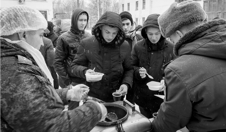
Солдатской каше мороз не страшен

— Ребята, одетые в чёрную форму, будут служить в ВМФ и морской пехоте, — поясняет начальник отдела подготовки и призыва граждан на военную службу областного