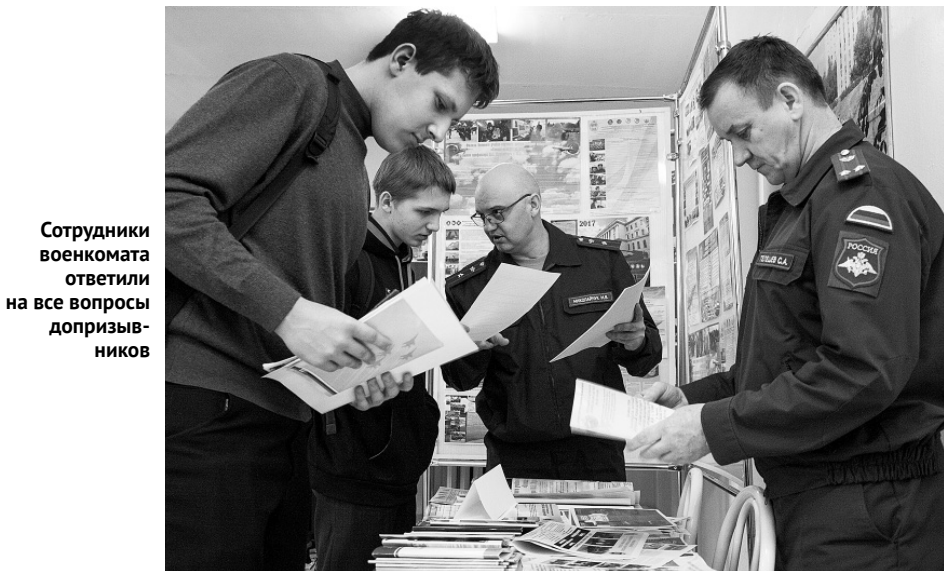
Сотрудники военкомата отвечали на все вопросы допризывников