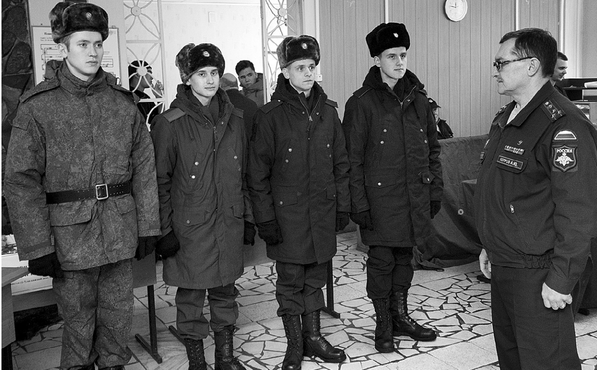
На сборном пункте ребятам выдают новую форму