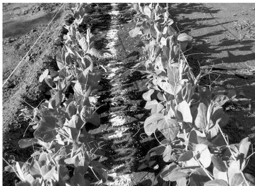
Бобы неприхотливы и урожайны

Бобы часто используют и в роли сидерального (зелёного) удобрения. При этом наиболее эффективно — за-