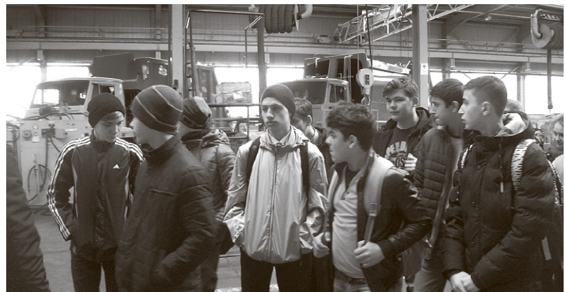
Возможно, для кого-то из этих школьников экскурсия на завод станет шагом к выбору профессии

— Такие экскурсии дают возможность юношам и девушкам получить представление о тонкостях производственных процессов, — считает директор центра занятости