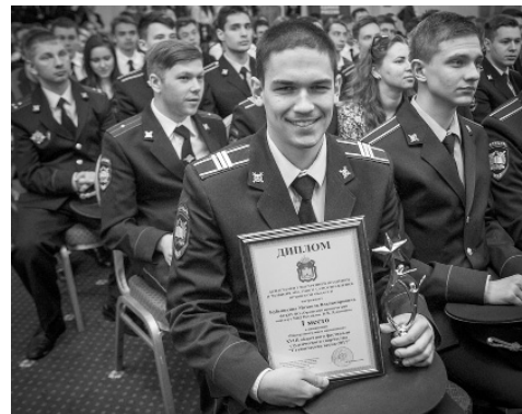
Юридический институт богат талантами

Тематика молодёжных проектов, представленных