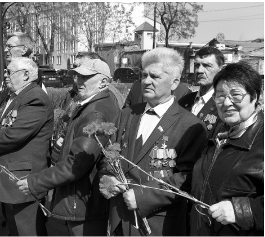
Орловские ликвидаторы с честью выполнили свой долг

ного Совета народных депутатов Леонид Музалевский подчеркнул, что в ликвидации чудовищной аварии на Чернобыльской АЭС участвовали более 600 тысяч жителей Советского Союза, среди которых — полторы тысячи наших земляков.