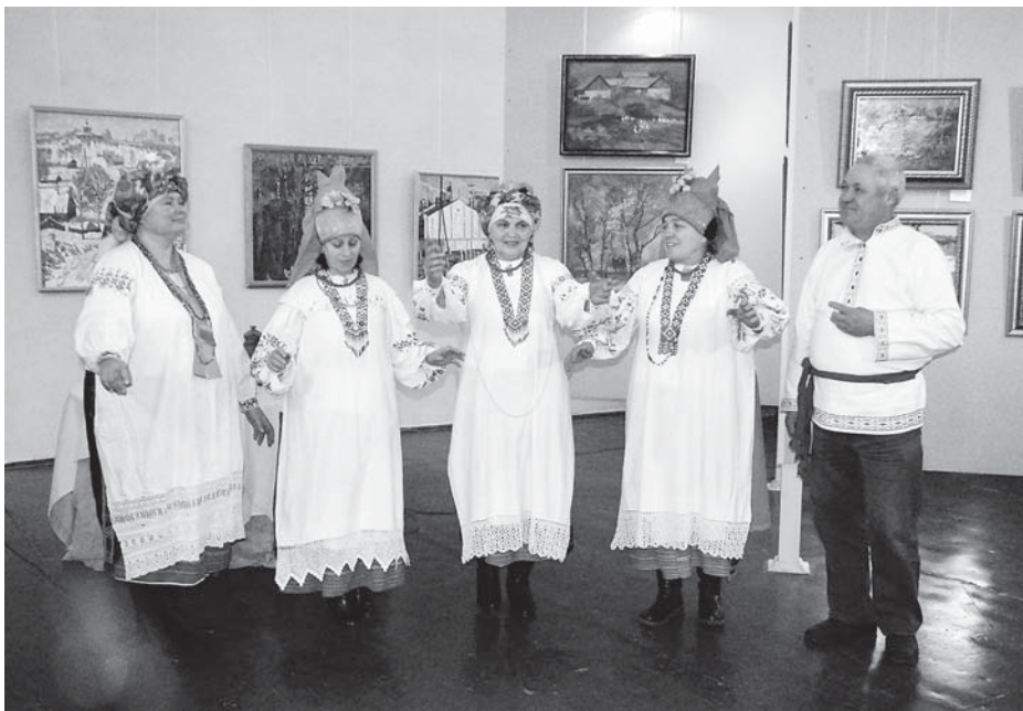
Фольклорный ансамбль «Калиновый садок» — гордость Хотынецкого района