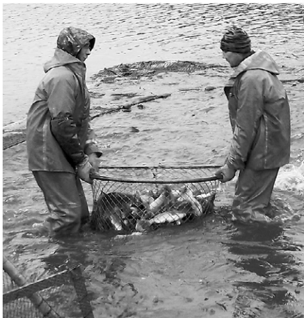
Рыбоуловитель хозяйства буквально кишит карпами