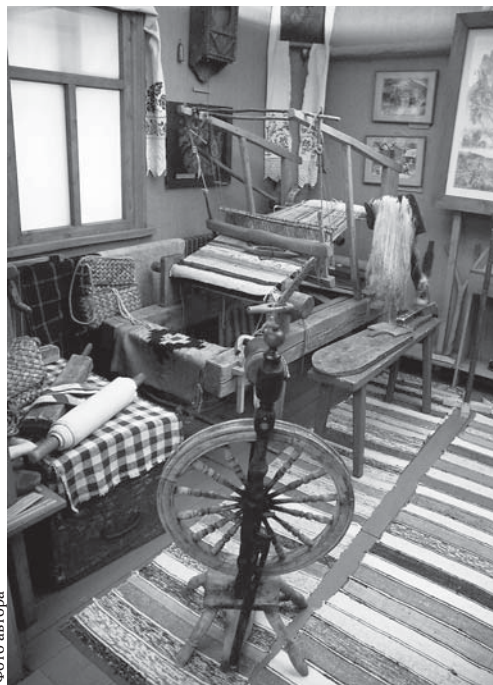
Ильинская старина — украшение музея

— Мы никогда наш Дом культуры не закроем — куда тогда идти селянам — он для них всё! Это место встреч — здесь собираются и стар, и млад, общаются новое поколение к богатству и традициям русской культуры, она в сельской глубинке и сохранилась-то, — убеждённо говорит Нелюдимова. — Сохранились корни, душа нации. Вот и получается, что