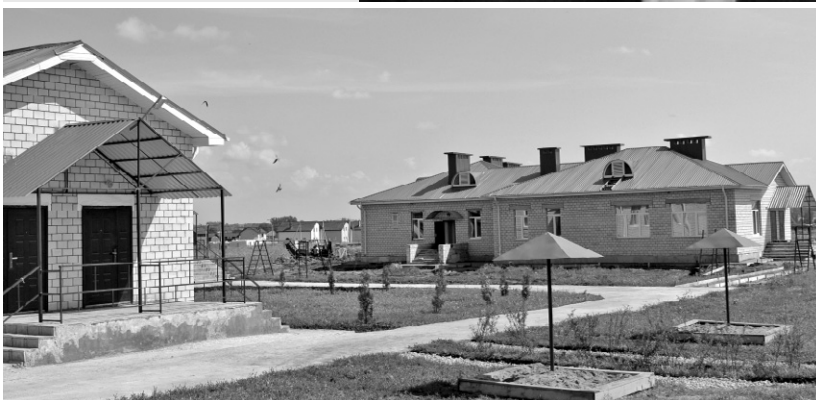
Такие дома ждут хозяев