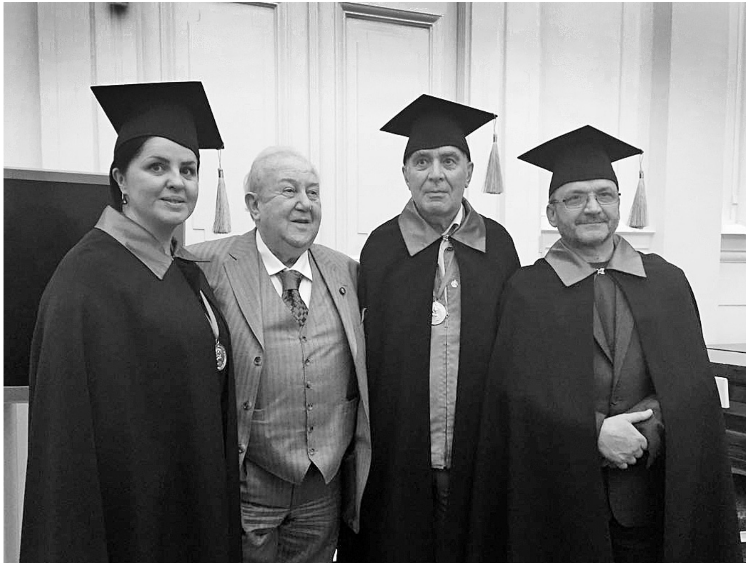
Зураб Церетели: — Достойным художникам — достойное звание!

В ответном слове награждённые назвали присвоение им звания почётных академиков своеобразным итогом пройденного творческого пути и замеча-