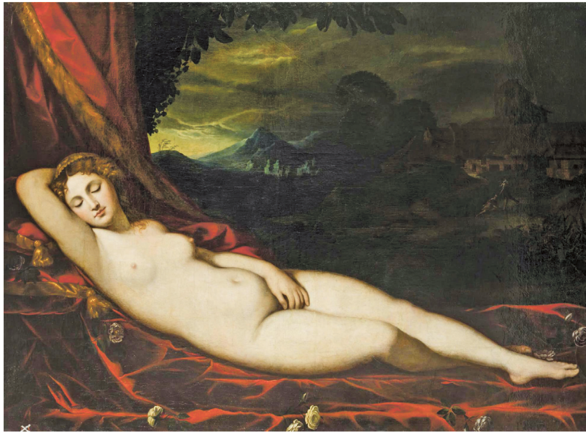
«Спящая Венера» много столетий вдохновляла великих мастеров живописи: Тициана, Гойю, Мане