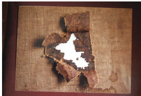
Реставраторам по крупным пришлось «собирать» авторский холст

В результате в масляном слое картины выявили берлинскую лазурь, которая начала использоваться в западноевропейской живописи с 1754 года, что точно позволило отнестись рождение «Спящей Венеры» к концу XVIII века. Изучив огромное количество материалов из многих музеев мира