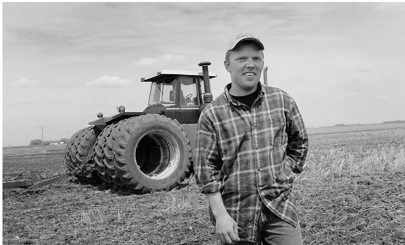
На своей земле работа в радость

Из общей суммы субсидий почти 37 млн. рублей составила грантовая поддержка семейных животноводческих ферм и начинающих фермеров, а также гранты на развитие материально-технической базы сельскохозяйственных потребительских кооперативов. Начи-