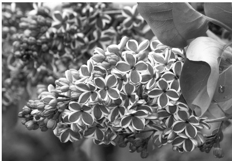
Сорт Джамбул селекции Леонида Колесникова

— Черенок сажают под наклоном 45 градусов, заглубляя в почву нижние почки. Землю вокруг утрамбовывают и создают тепличные условия. Главное, чтобы была высокая влажность и защита от прямых солнечных лучей, — подчёркивает Павленкова. — Период укоренения — длительный. Сна-