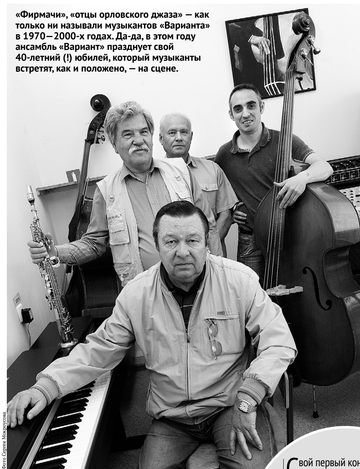
Музыканты признаются: джаз — секрет их бодрости и хорошего настроения

Музыканты, не выпуская из рук инструментов, дружно смеются, вспоминая боевую джазовую молодость. Начинать играть в ресторане гостиницы «Орёл», а когда в 1983 году стали лауреатами всесоюзного джазового конкурса, вмиг получили известность буквально по всей стране. В скольких городах и сёлах побывали музыканты — сейчас они уже не вспомнят, зато не забыли, как на их концерты ломались толпами, как не хватало мест в концертных залах, как поклонники лезли по водосточным трубам музыкального училища, чтобы хоть одним глазком увидеть джазовых «звёзд», хоть одним уш-