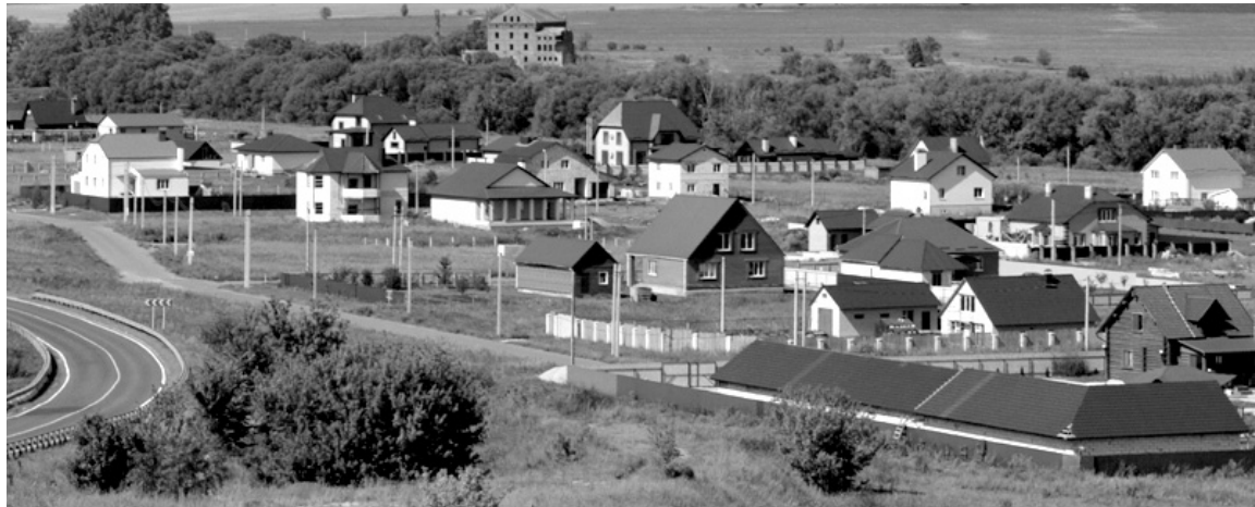
Современный посёлок за городом