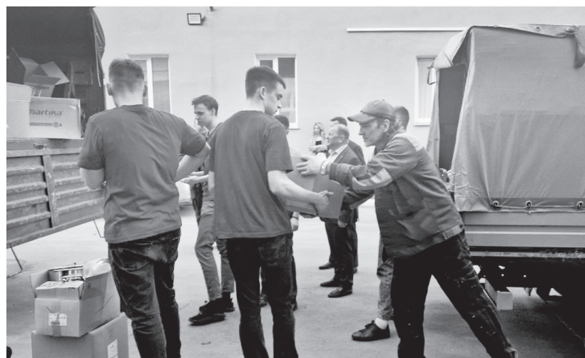
Орловщина организовала бесперебойный конвейер гуманитарной помощи фронту

ных внедорожниках бойцам передали три комплекта резины. Кроме того, в груз включили несколько бензопил с запасными цепями, а также более десяти электрических тепловых пушек и печей солярогаз.