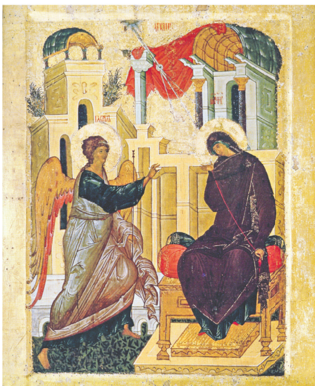
Икона Благовещение Пресвятой Богородицы

Как ни странно это прозвучит, но в момент явления архангела Гавриила решалась судьба всего человечества в плане домостроительства спасения. Могла ли Пресвятая Богородица