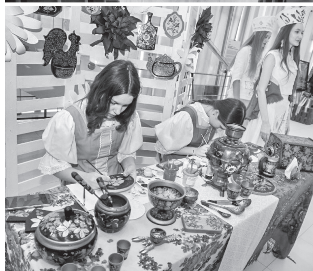
На выставке были представлены традиционные белорусские народные ремёсла