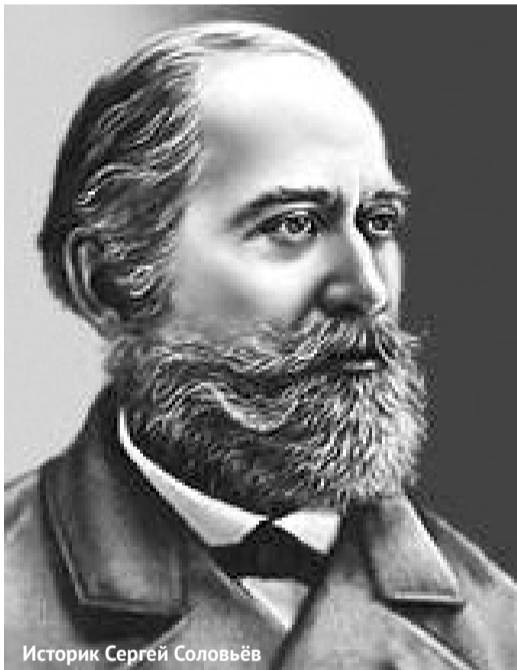
Историк Сергей Соловьёв