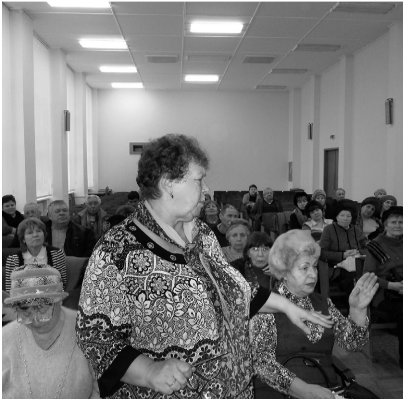
В школе жилищного просвещения скудно не бывает

— На занятиях мы помогли жильцам написать заявление в жилищную инспекцию о нарушении. Но от неё пришёл ответ: мол, всё сделано по правилам, —