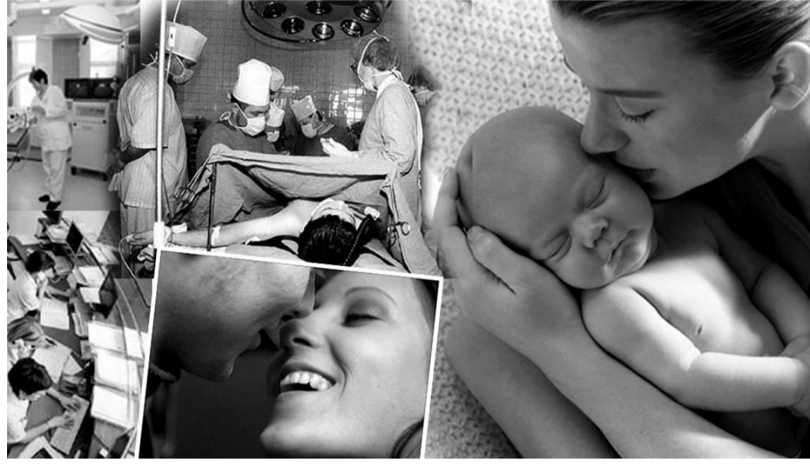
Коллаж Сергея МИРОНОВА.