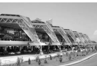
летние месяцы будут нагревать солнечные коллекторы, установленные на крыше.

Старый терминал уже закрыт, и теперь все рейсы — местные и международные — будет принимать новый аэровокзал. Его пропускная способность составит две с половиной тысячи человек в час. Помещение оснащено энергосберегающим оборудованием, датчиками и регуляторами качества воздуха. Воду в здании нового терминала в