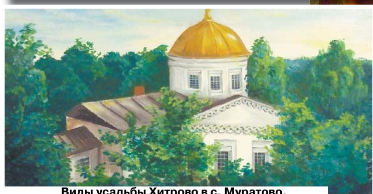
Виды усадьбы Хитрово в с. Муратово.