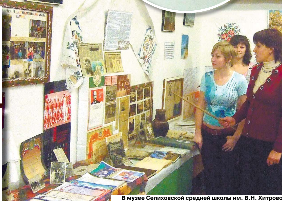
В музее Селиховской средней школы им. В.Н. Хитрово.