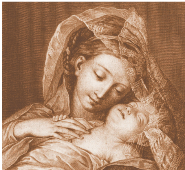
Франческо Бартолоцци (1728—1815). «Мадонна с младенцем»

Хотя выставка четко поделена на «английскую» и «итальянскую» половины зала, в жизни такого разделения быть не могло. Итальян-