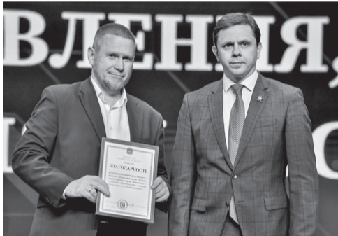
Награда от главы региона