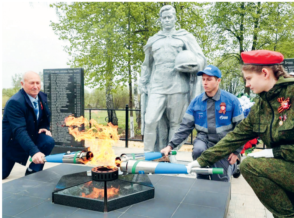
Газовщики передали частицу Вечного огня юнармейцам