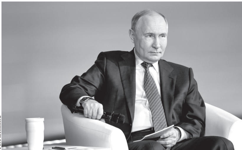
Владимир Путин: — День Победы — это триумф нашего народа!

В связи с этим Владимир Владимирович предпринял, думается, успешную попытку достучаться до молодых душ участников просветительского марафона, рассказав о глубоко личном — семейном эпизоде, связанном с письмом, которое ему передала родственница. «Это письмо моего дедушки, которое он писал... во время войны своему сыну, который был в действующей армии. Он рассказывает о том, как погибла его жена, то есть мама его сына. Шла перестрелка, ей пуля попала в живот, и она у него на руках умерла, у дедушки. И когда умирала, сказала... Она понимает, что умирает, а ему говорит (это он всё в письме пишет): «Не плачь, не расстраивай меня». Умирая, думает о нём... А в конце вывод: «Бей этих гадов!» Вы понимаете, мотивация была какая! Это