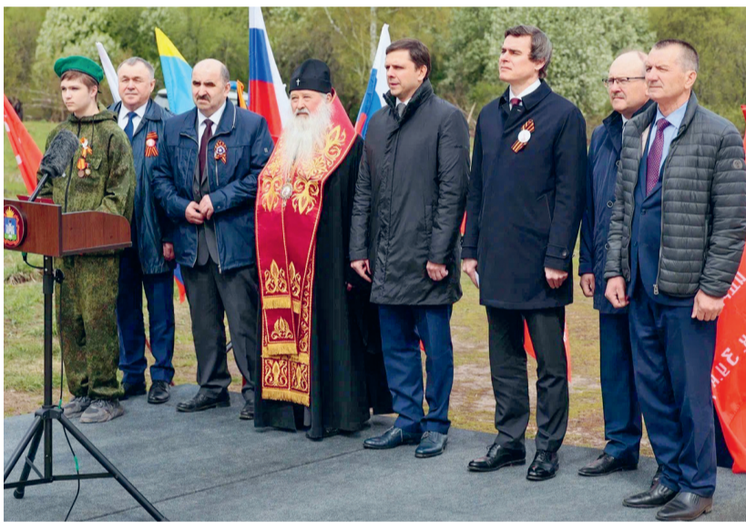
В братской могиле д. Хотетова покоится прах 493 бойцов

Он также отметил, что герои специальной военной операции — прямые продолжатели славных военных традиций воинов Великой Отечественной. И, помня о прошлом, мы защищаем наше будущее.