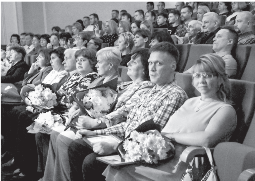
Важный атрибут праздника — букеты цветов в руках женщин