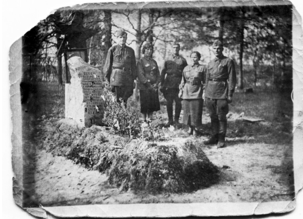
Однополчане у могилы отважных лётчиков