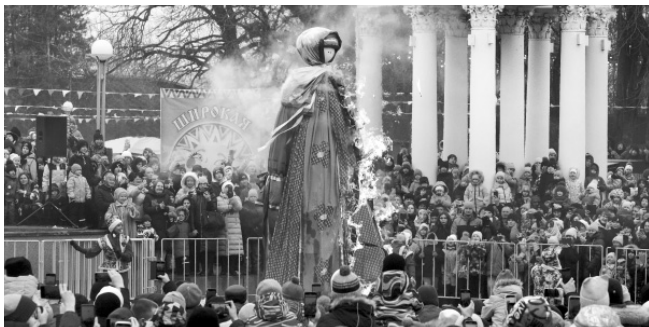
ПРОЩАЙ, СУДАРЫНЯ МАСЛЕНИЦА! Стр. 6