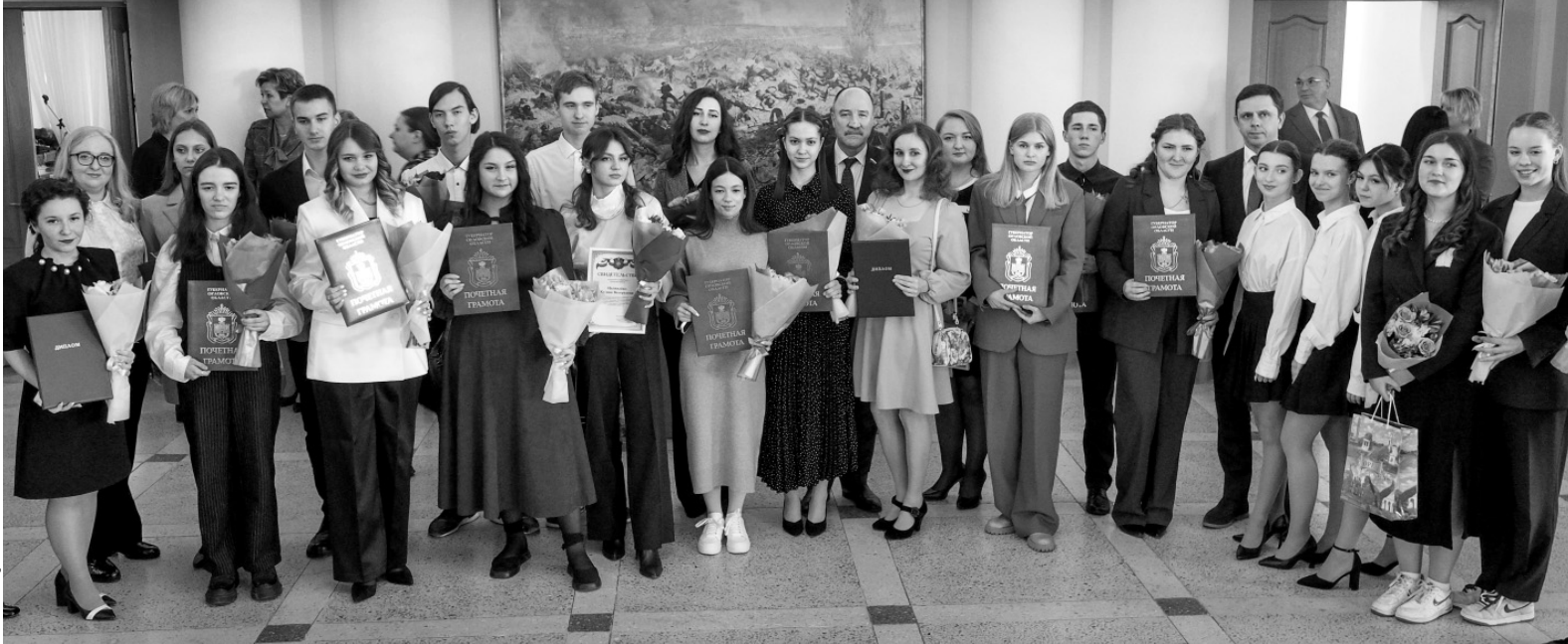
Не скудеет Орловщина талантами

В ходе торжественной церемонии глава региона Ан-