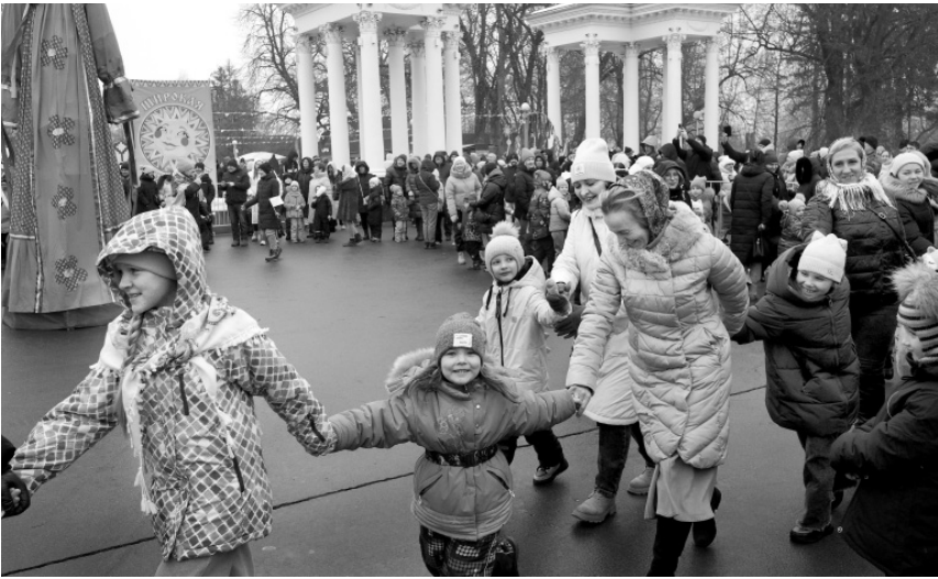
Вставай, орловский народ, в весёлый хоровод!