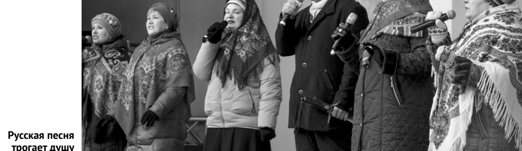
Русская песня трогаёт душу

том, у меня отличная физическая форма, но, честно говоря, было тяжело. Вот..