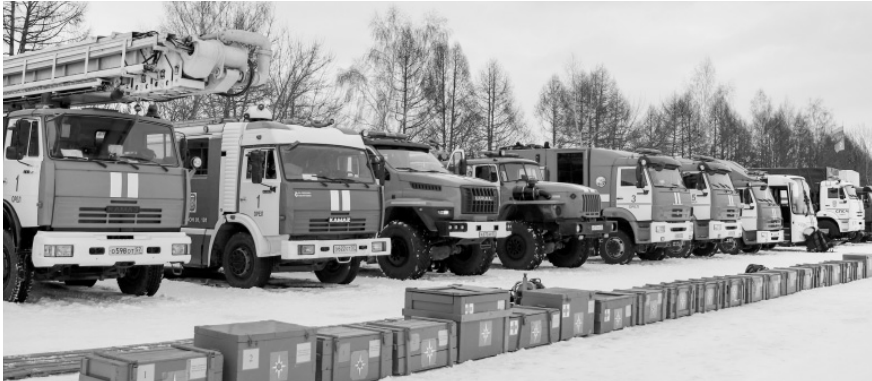
На службе МЧС — современная и надёжная техника

В Орле прошла масштабная тренировка действий по реагированию на ЧС с привлечением аэромобильной группировки ГУ МЧС России по Орловской области.