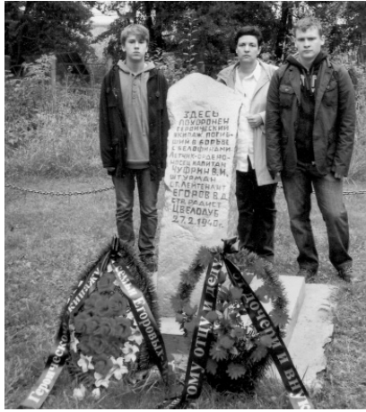
На могиле деда и прадеда