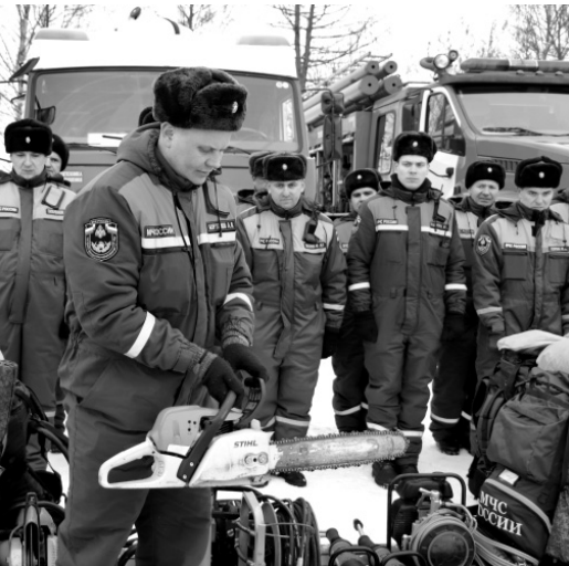
Демонстрация оборудования аэромобильной группировки