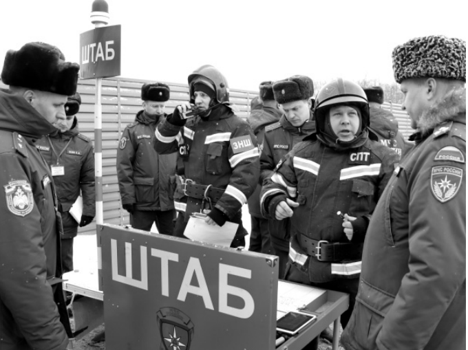
Последние указания перед учениями

По замыслу тренировки, в результате короткого замыкания произошло загорание в кинотеатре на третьем этаже здания. Администрация сообщила об этом по телефону 101 на пожарно-спасательную службу и приняла меры по эвакуации работников и зрителей, отключению электроэнергии. К месту пожа-