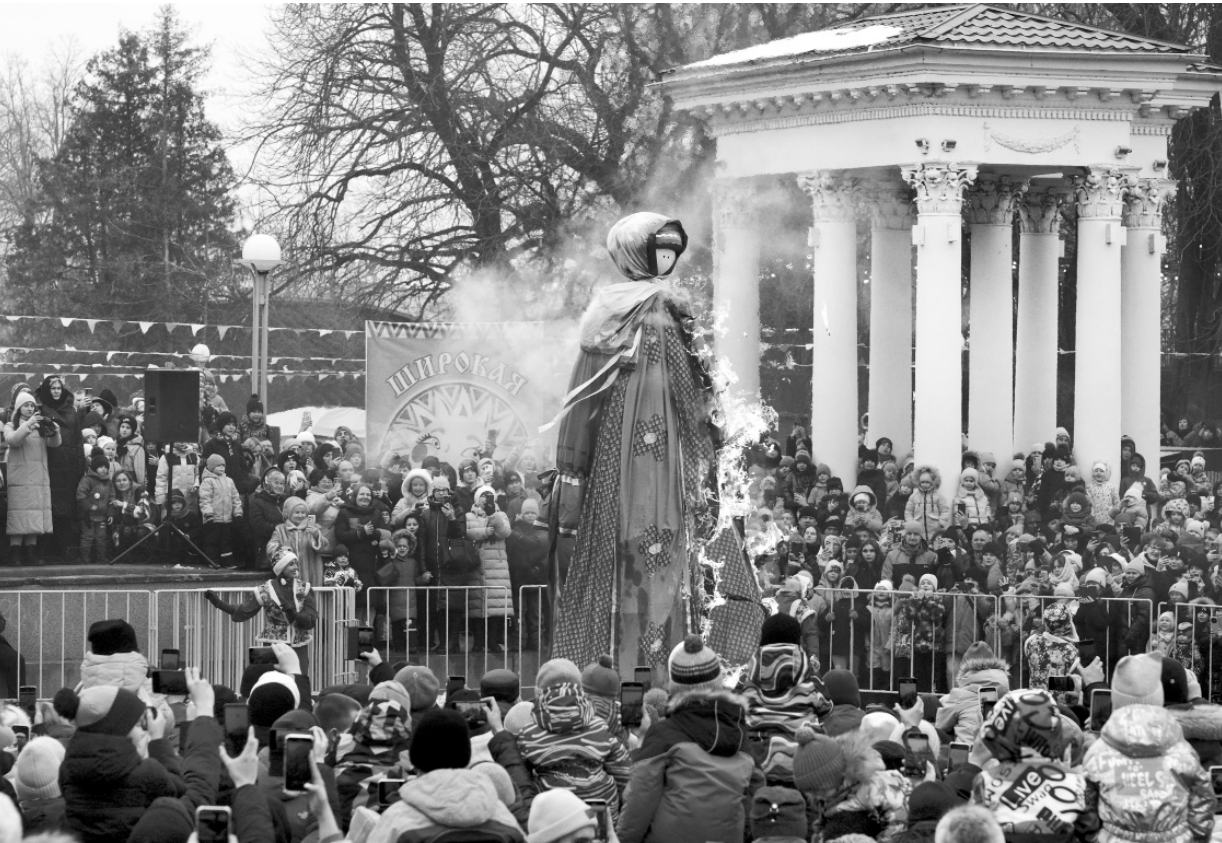
Гори, Масленица, ярче, чтобы лето было жарче!

— Несколько раз едва не скатился вниз, — рассказал довольный орловец. — Но когда слышал аплодисменты и поддержку зрителей, как будто наполнялся новой силой и полз выше. Сейчас пойдём с другом отмечать победу! Я с детства занимаюсь спор-