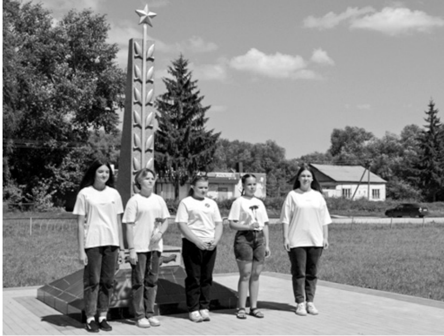
Памяти павших будем достойны!

низоны в селе. В декабре 1941 года она ещё шесть раз передавала оперативную информацию в разведотдел армии.