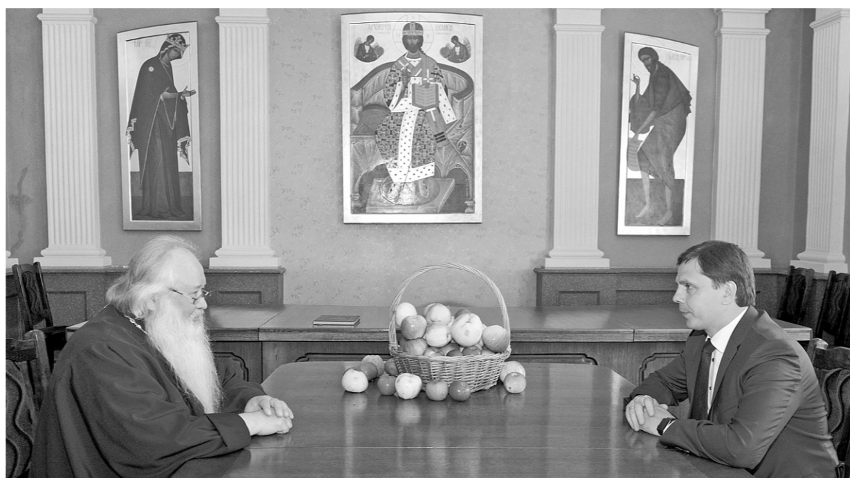
У церкви и власти одна цель — укрепление мира

В праздник Преображения Господня митрополит Орловский и Болховский Тихон освятил плоды нового урожая