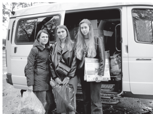
Подарки вынужденным переселенцам