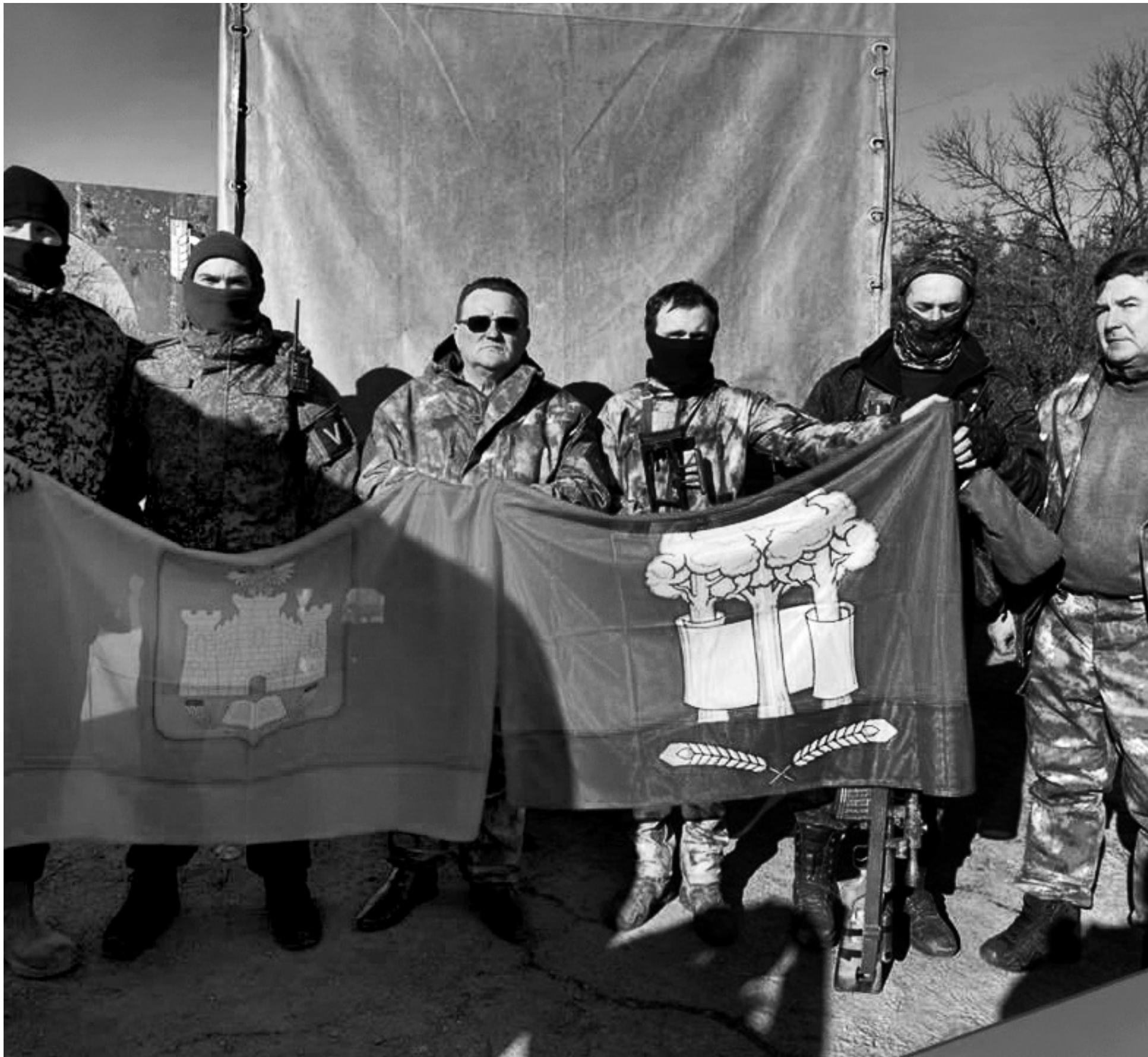
Орловским бойцам — от жителей Свердловского района

Жители Свердловского района собрали очередной гуманитарный груз весом 2,5 тонны для бойцов специальной военной операции.