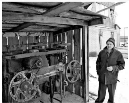
...Пройдет зима, снимет с себя снежное покрывало, и в крестьянском хозяйстве «Русь» вновь

— Долгие зимние вечера — самое время для того, чтобы отдохнуть, — говорит фермер, имея в виду работу на пиломатериале, которую сам и построил.