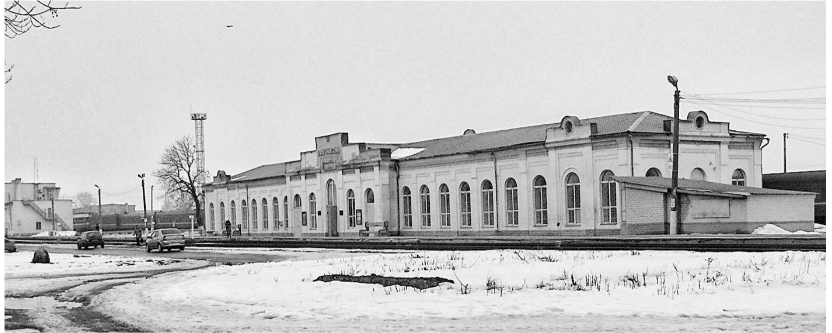
Здание вокзала было построено в конце XIX века

Вдоль железной дороги стоит старинный дом, за ним еще один. А между ними неожиданно расположился магазин косметики. В конце неприглядного проулка притаилась еще и аптека. Для нас, жителей более крупного населенного пункта, расположение аптеки, мягко говоря, непривычное. В городах пред-