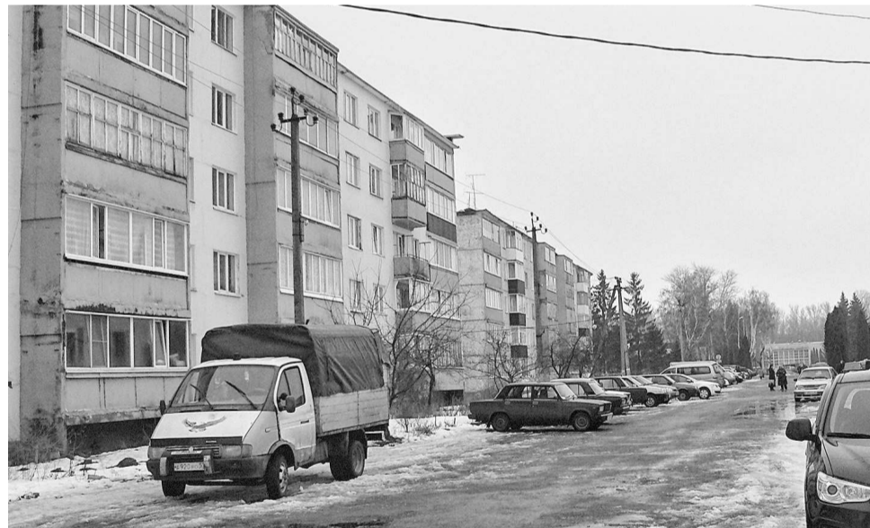
В центре Верховья стоят пятиэтажные дома

находится хозяин учреждения, он же продавец. Бизнес в Верховье не роскошь, а скорее средство выживания. В поселке многие предприниматели работают сами у себя, не нанимая работников. У хозяина аптеки интересуемся: поче-