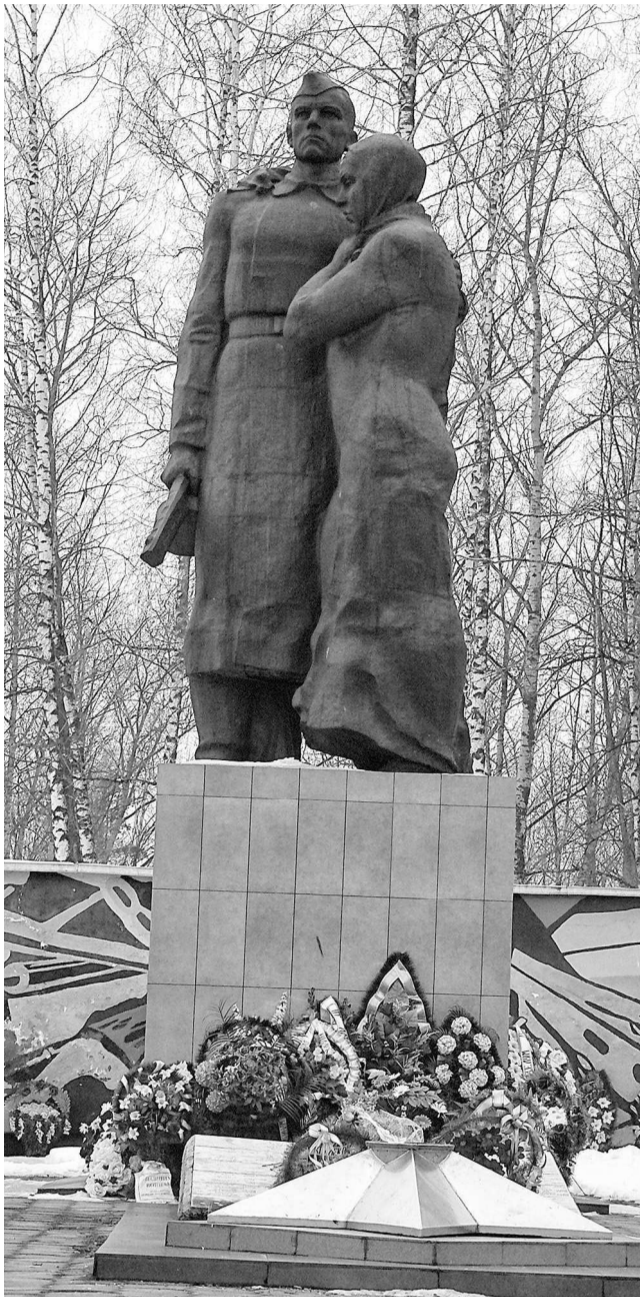
Возле мемориала Славы в центре Верховья горит Вечный огонь

РЖД здесь посвятили даже памятник — настоящий паровоз, который работал на этой дороге в 20-м веке, а теперь уже которое десятилетие подряд стоит на вечной стоянке, украшая поселок.