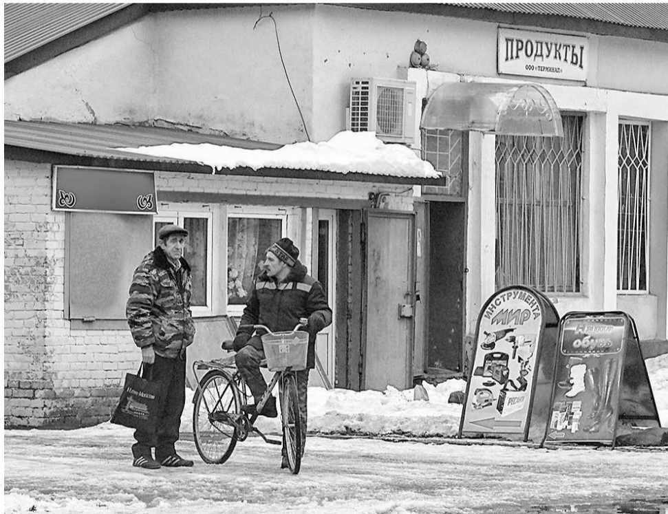
Верховцы не расстаются с велосипедами даже зимой

Отправляемся на экскурсию в одну из них — школу № 1. Ворота перед территорией открыты. Нет ни сторожей, ни охранников. Мы спокойно заезжаем на школьный двор на редакционном автомобиле и проезжаем вокруг всего здания. Появление на территории неизвестного автомобиля ни у кого не вызывает возмущения. Решаемся войти внутрь школы. Перед входом готовим журналистские удостоверения, но у нас документы никто не спрашивает. Мы беспрепятственно попадаем на территорию самой большой в районе школы! Прой-