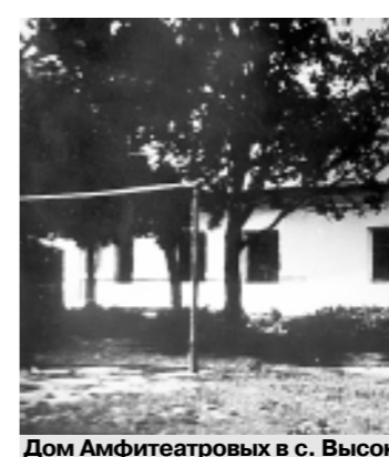
Дом Амфиитеатовых в с. Высоком. Фото 1970-х годов.