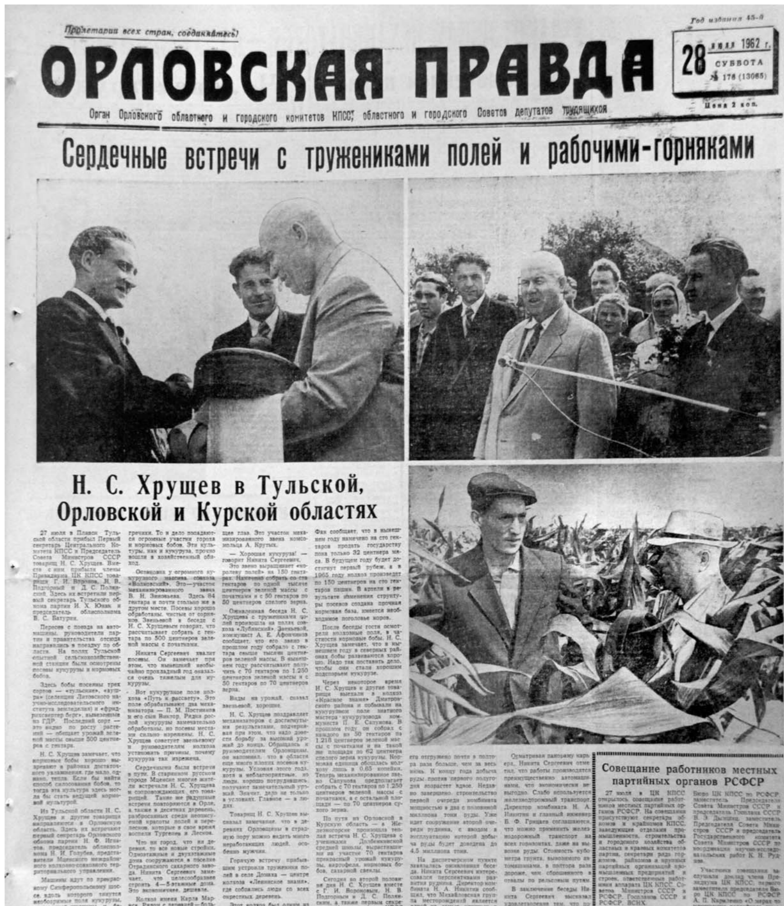
Первая полоса «Орловской правды» от 28 июля 1962 года

На очереди был Кромский район. Не доезжая до Кром, кортеж остановился в колхозе «Путь к рассвету» (деревня Черкасская). Кукурузное поле Хрущеву