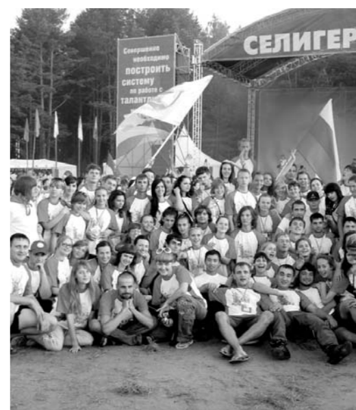
В 2012 году молодежи на Селигере будет не меньше, чем в прошлом

Последняя смена. Федеральный проект «Политика» стартует с 25 июля. Цель проекта — сбор молодежи, небезразличной к судьбе страны, стремящейся сделать Россию развивающейся и комфортной для проживания.