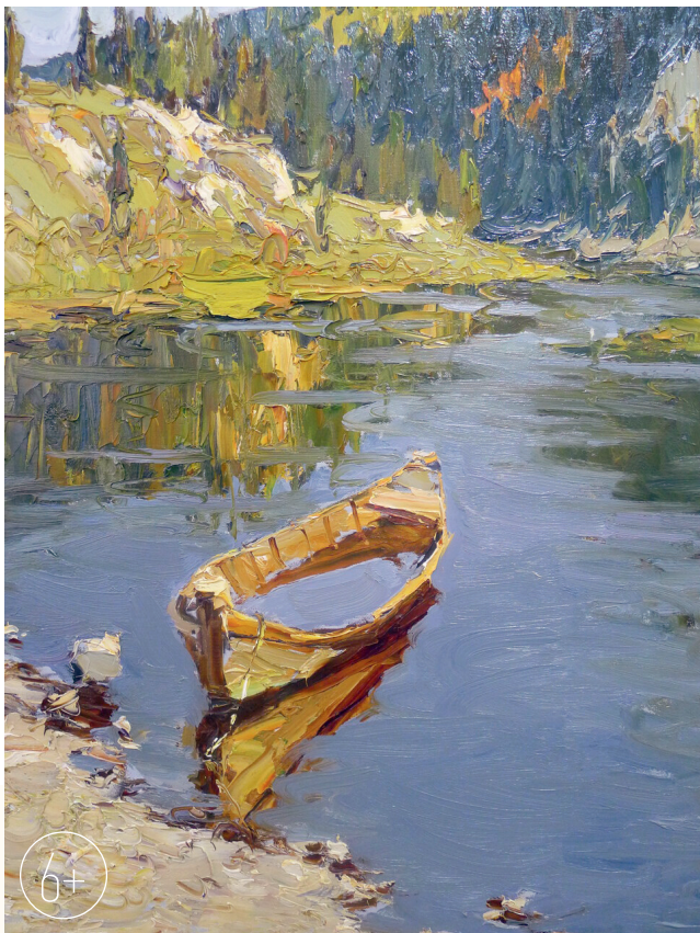
«На уральской реке». 2012 г.