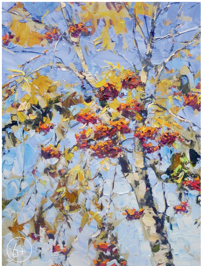
«Сентябрьская рябина». 2019 г.