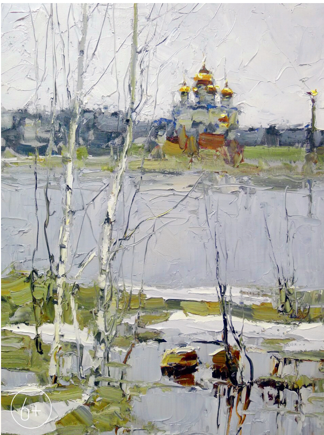
«Благовещение». 2020 г.