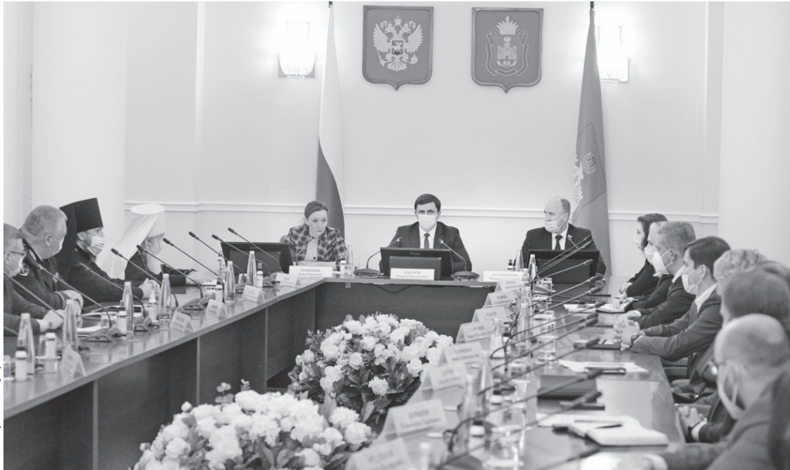
В центре внимания — проблемы детей

Председатель областного Совета обратился к Анне Кузнецовой, которая до недавнего времени занимала должность детского омбудсмена при президенте России, с просьбой инициировать рассмотрение вопроса о внесении изменений в Федеральный закон от 21 ноября 2011 года № 323-ФЗ «Об основах охраны здоровья граждан в Российской Федерации», что позволило бы продолжать лечить пациентов с паллиативным статусом после того, как им исполнится 18 лет, в орга-