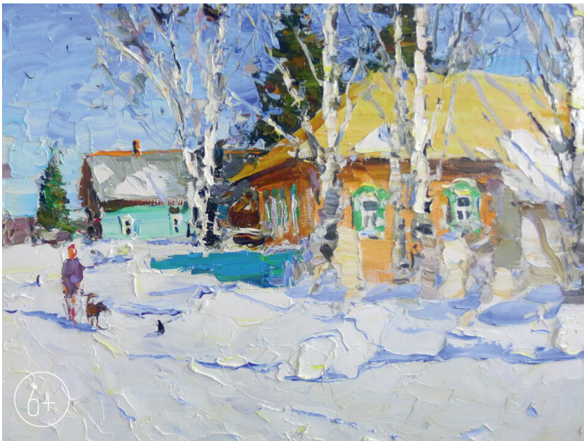
«Март в деревне». 2021 г.