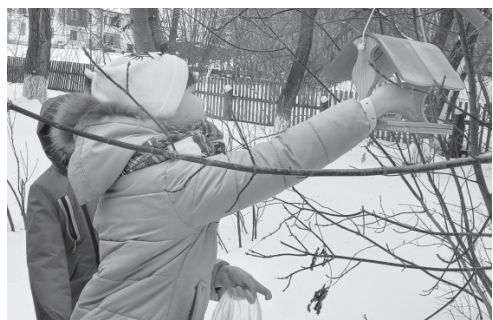
Покормите птиц зимой

Вот рецепт птичьего лакомства: растопите несоленое сало, перемешайте с семенами