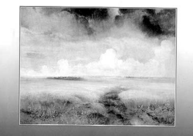
ОРЕЛ • 2006