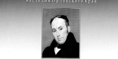
Владимир Власов ДВОРЯНСКАЯ УСАДЬБА БУНИНО

Библиотечная серия Историко-культурного наследия Орловского края