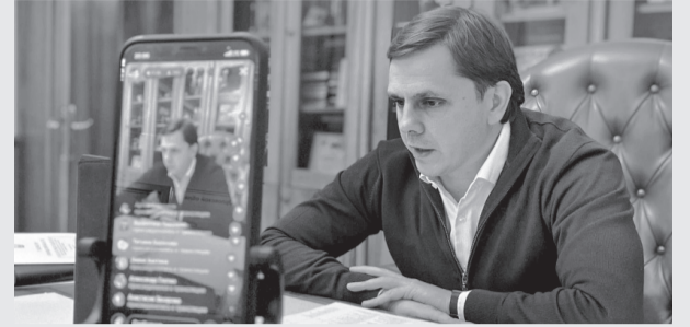
Главное из прямого эфира в социальных сетях губернатора Орловской области Андрея Клыčkова за минувшую неделю.