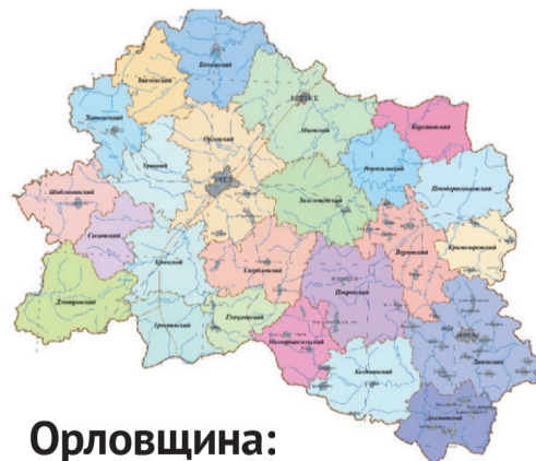
Орловщина: районные будни