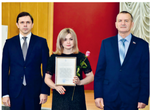
Мастера тепла и света