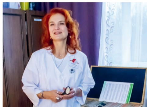
Офтальмолог, которого ждали