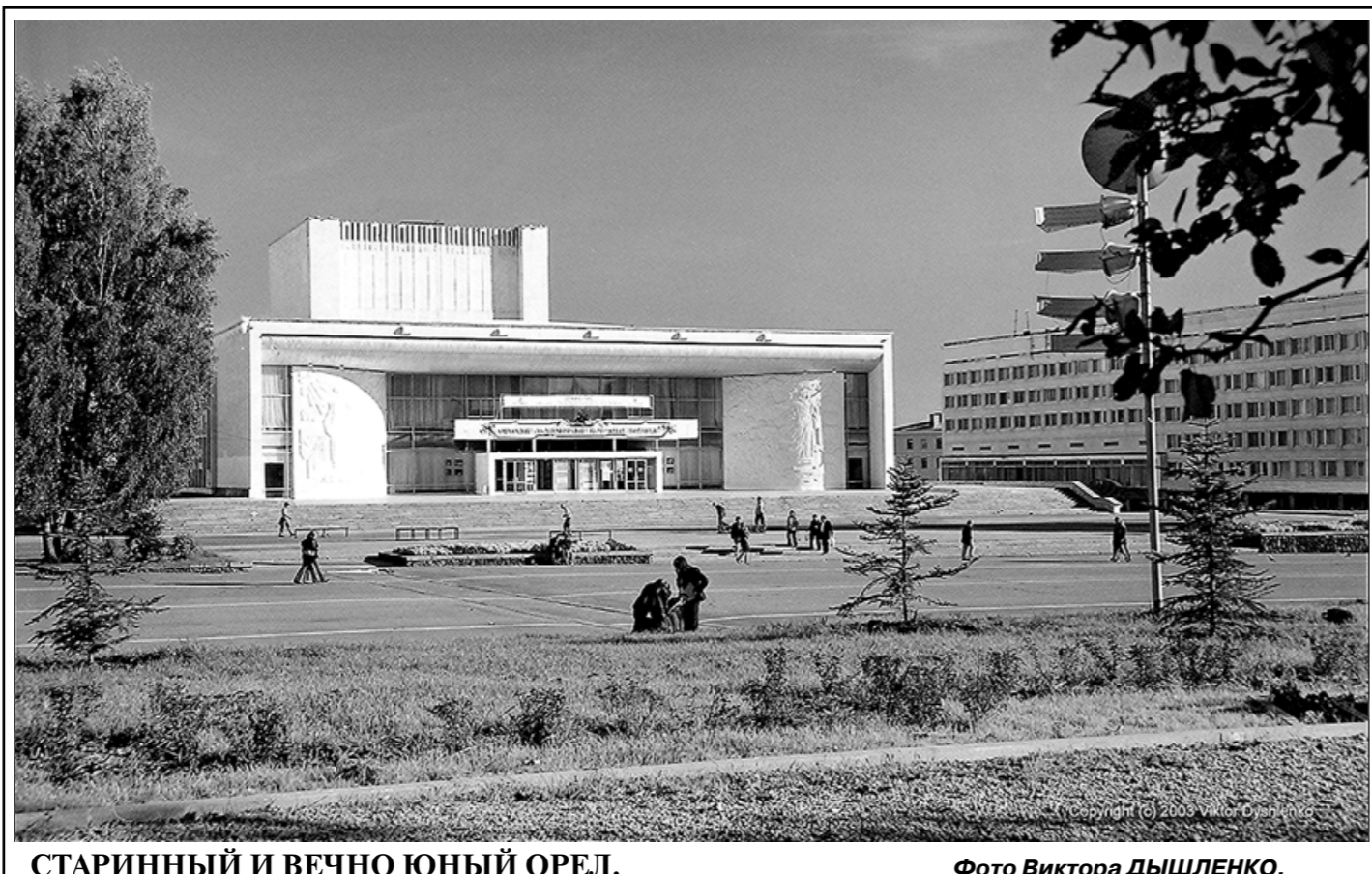
СТАРИННЫЙ И ВЕЧНО ЮНЫЙ ОРЛ.