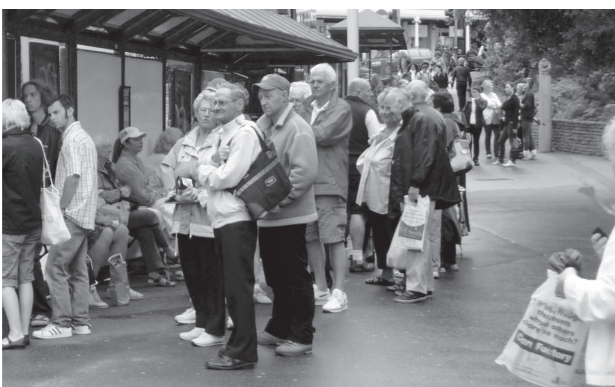
Пока не проведен конкурс, ни одна частная маршрутка в городе не соблюдает график

— Они собирают деньги с предпринимателей за распределение маршрутов, а также за несуществующие услуги: абонентскую плату, штампы за медосмотры, техосмотры. Люди, которые держат в руках золотого теленка, просто боятся потерять деньги. Они, полагаю, действуют не в интересах горожан, а в интересах своего кармана. Мы только и делаем, что ведем переговоры с перевозчиками, идем им на уступки, но результата нет. Если перевозчики не вый-