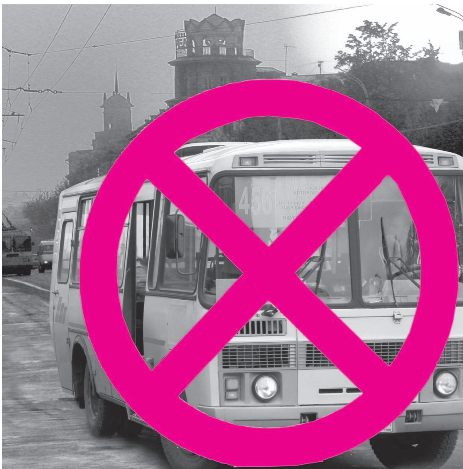
Автобусы должны возить пассажиров, а не стоять на остановках

Лично мне как пассажиру, который платит деньги за то, чтобы его как можно быстрее и безопаснее довезли до нужного места, глубоко наплевать, какой перевозчик меня везет. Лишь бы водитель был трезвый, маршрутка не разваливалась на ходу и не ждала ее по часу на остановке. В принципе, чего и требуют условия нового конкурса, затеянного городской администрацией: чтобы у каждого перевоз-