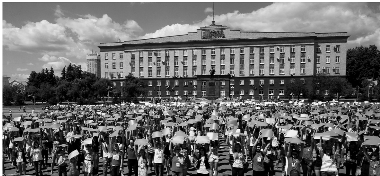
Участники акции «Твой День России»