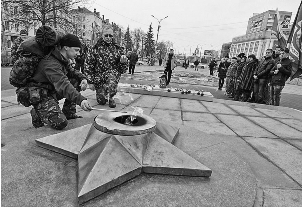
Участники эстафеты Памяти-2015 передали лампаду с частичкой Вечного огня, который пронесли по местам кровопролитных боёв Великой Отечественной войны через Москву, Тулу, Кривцово, Болхов, орловским поисковикам. Среди последних — члены поискового отряда института «Факел». 23 февраля 2015 г.

В числе других мероприятий к Дню Победы — проведение IX Межрегионального конкурса исполните-