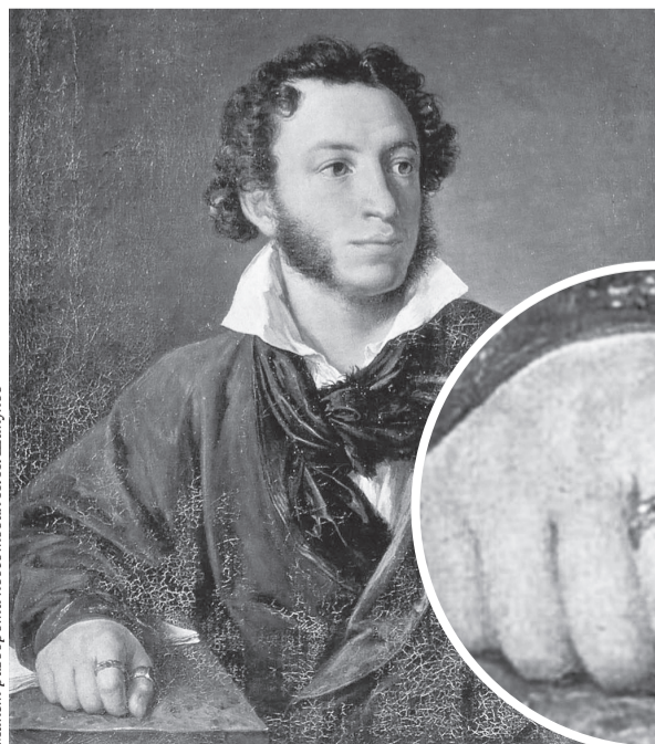
Макет разворота подготовил И. Шикунов

Имя Пушкина увековечено в названиях улиц, театров и станций метрополитена. В 1943 году в Советском Союзе был построен боевой самолёт под названием «Александр Пушкин». Истребитель сбил девять фашистских бомбардировщиков. Имя поэта увековечено и в космосе: одна из малых планет носит название «2208 Pushkin», а на Меркурии именем великого поэта назван один из кратеров. В мире насчитывается примерно 270 памятников великому поэту. Они находятся в России, Армении, Греции, Канаде, Мексике, Турции, Бельгии, Китае, Словакии и других государствах. Большой интерес представляет памятник Пушкину в Эфиопии, откуда произошли предки поэта. В столице государства Аддис-Абебе установлена бронзовая фигура Пушкина, а на мраморном постаменте высечена надпись: «Нашему поэту».