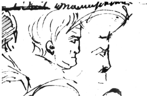
А. П. Ермолов. Рисунок А. С. Пушкина

Дальше взгляду поэта предстал орловский «Тюремный замок», тоже не-