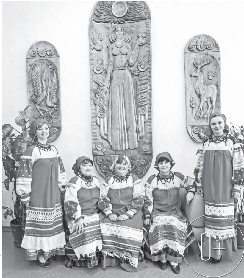
От песен «Любавушки» на душе светло

Ансамбль сохраняет и приумножает народные песенные традиции родного болховского края, включая их в репертуар: это шуточные, плясовые, карагодные, лирические, обрядовые песни, авторские произведения и обработки народных песен.