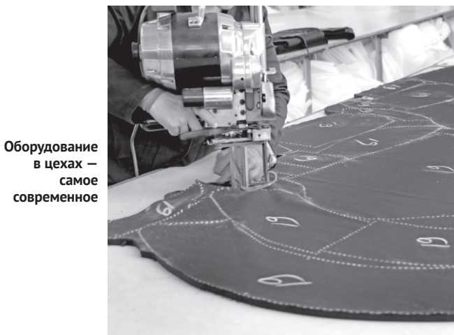
Оборудование в цехах — самое современное