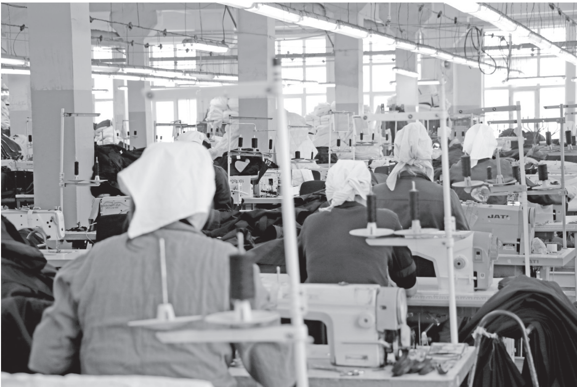
За работой время летит быстрее