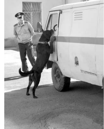
Здесь содержится более пятидесяти питомцев, обученных распознавать наркотики, обнаруживать оружие и взрывчатые вещества. Собак привлекают к работе во время проведения оперативно-профилактических мероприятий, при проверках на постах ДПС.

Центр кинологовической службы УВД, расположенный на окраине города Орла, самостоятельно найти непросто. Понадобилось несколько минут езды на машине от конечной остановки трамвая № 4, прежде чем перед высоким забором с металлическими воротами громогласный лай возвестил о том, что мы на месте.