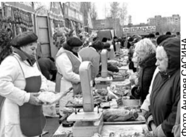
на все виды продукции были гораздо ниже рыночных. К примеру, килограмм сахара при покупке целого мешка стоил 16 рублей, капуста и картофель — от 3 до 4,5 рубля, зерно — в пределах 2—3 рубля.

По информации, предоставленной областным управлением торговли и потребительских ресурсов, наибольшим спросом у покупателей пользовались мясная продукция, зерно, сахар, комбикорма, мед, картофель и овощи. Цены