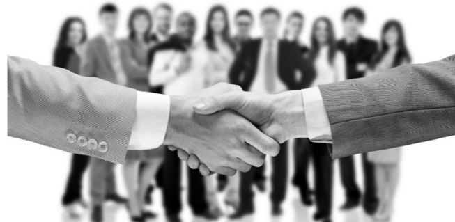
«Лучший коллективный договор года» Стр. 4