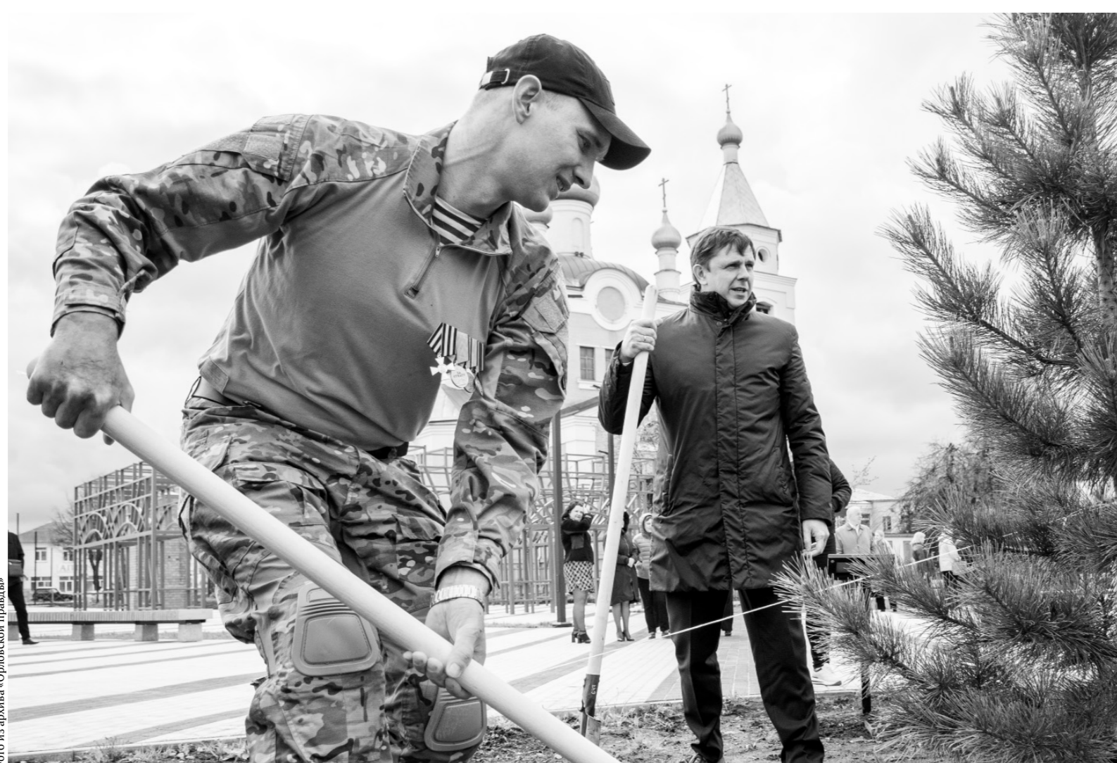
Одно из деревьев — сибирский кедр — посадил в центре Змиёвки губернатор Андрей Клычков

Возмущение вызвала и выкорчевка деревьев в парке Воинской Славы — люди привыкли, что эта территория всегда была тенистым оазисом.