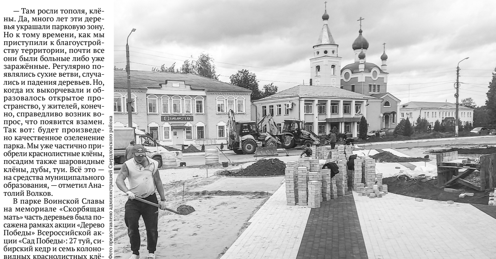
В результате реализации проекта в посёлке произошли кардинальные перемены