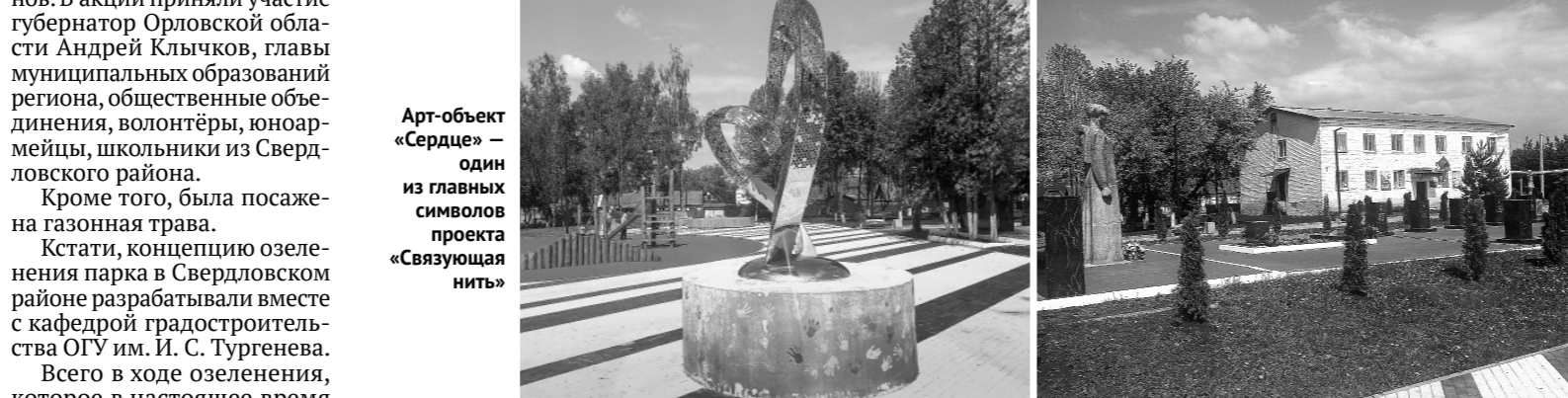
Арт-объект «Сердце» — один из главных символов проекта «Связующая нить»