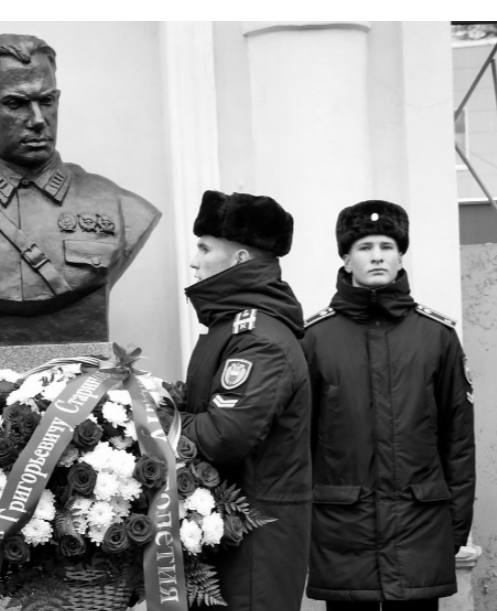
Наша страна гордится такими героями, как Илья Старинов!

Открытие бюста состоялось 20 декабря у здания