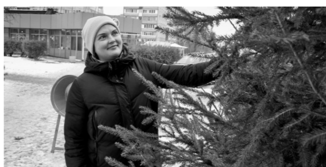
Ёлочка, ёлка — лесной аромат! Стр. 12