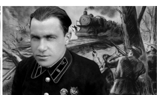
Если мы не будем помнить о прошлом — будущего не будет!