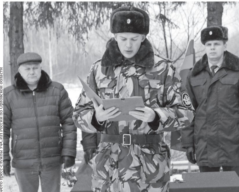
Принятие присяги сотрудниками ИК № 5

виях созданы комнаты воспитательной работы, оборудованные мягкой мебелью, живые уголки, установлены душевые кабины.