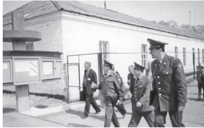
Визит в колонию сотрудников Управления исполнения наказаний (конец 1990-х гг.)

Для отбывающих наказание в облегчённых усло-