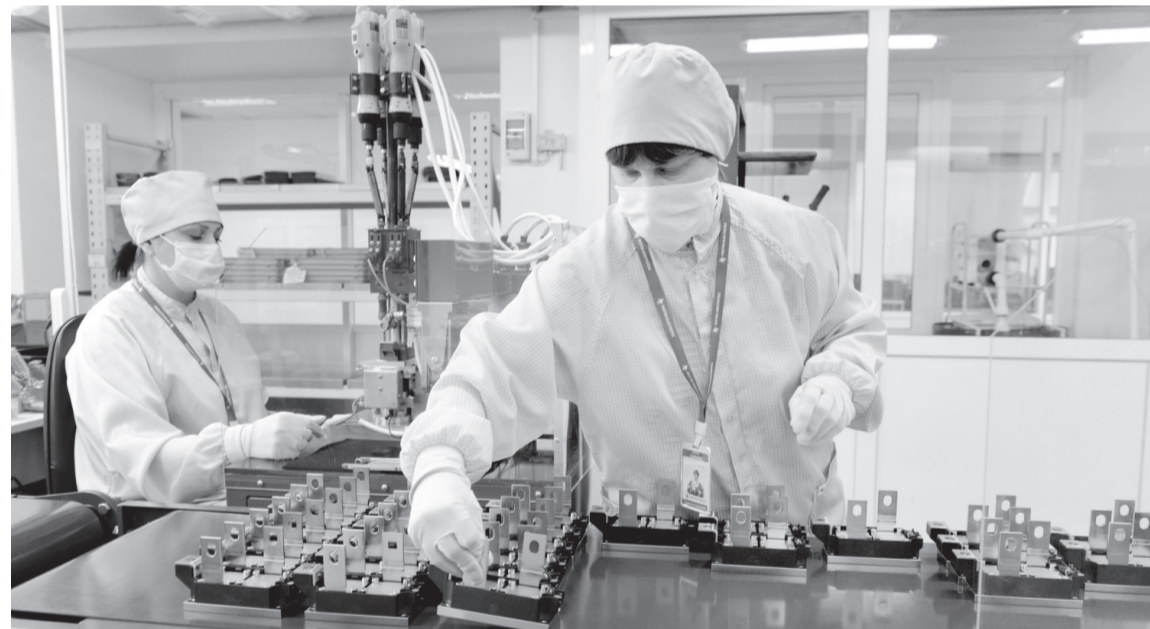
Завод «Протон» — один из лидеров электронной промышленности региона

Именно эти вопросы рассмотрели участники круглого стола, организованного профильным комитетом областного Совета. В заседании приняли участие представители правительства и органов исполнительной государственной власти специальной компетенции Орловской области, органов