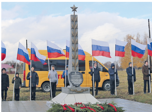
Открытие стелы «Населённый пункт воинской доблести»

— Новосильцы с нетерпением ждут открытия тепличного комплекса, где десятки из них смогут получить стабильную работу. Мы стараемся привлечь в район и других инвесторов. Сегодня есть определённые перспективы в молочном животноводстве. Так, ООО «Нобель-мол» планирует строительство крупного животноводческого комплекса, на котором будет создано 100 рабочих мест.