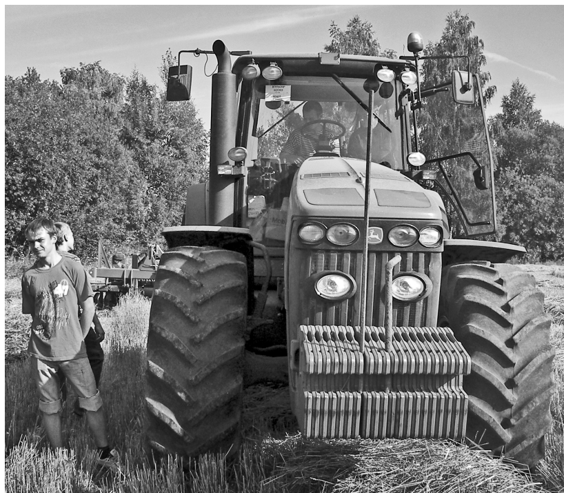
Студенты техникума агробизнеса и сервиса на полевых работах в ООО «Отрада-агроинвест»

перед системой среднего профессионального образования?