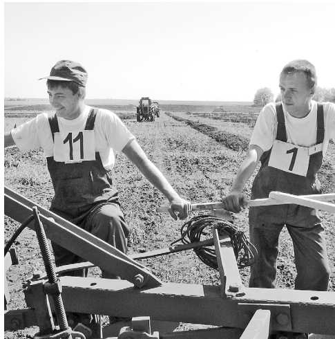
Конкурс профессионального мастерства

— Система регионального профессионального образования в современных условиях должна отвечать на разнообразные вызовы. Назову, на наш взгляд, актуальные. Во-первых, размытие междисциплинарных и отраслевых границ, что хорошо иллюстрирует современное сельское хозяйство. Мы с этим вплотную столкнулись при организации регионального чемпионата «Молодые профессионалы», основанного на методиках мирового движения WorldSkills, членом которого является Россия. Во-вторых, одновременный процесс и роста сложности, и скорости протекания процессов в технологиях. Снова сошлось на приведённый выше пример с региональным чемпионатом, так как условия заданий регионального чемпионата по компетенции «Эксплуатация сель-