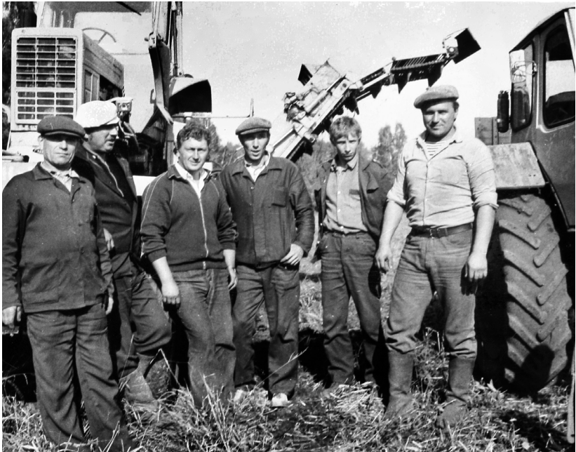
Фото из воспоминаний Орловской области

Они и в самом деле работали от души. Не надрываясь, не думая о лаврах — но так, чтобы не было стыдно за результат. А результат для членов звена был важен, поскольку работали на хозрасчёте — в ту пору такая система хозяйствования и стимулирования труда в аграрном секторе активно внедрялась и, надо сказать, приносила свои плоды. Хозрасчёт предполагал большую самостоятельность для таких звеньев. Допустим, вырастил хозрасчётный коллектив урожай, совхозные экономисты подсчитали его стоимость в денежном выра-