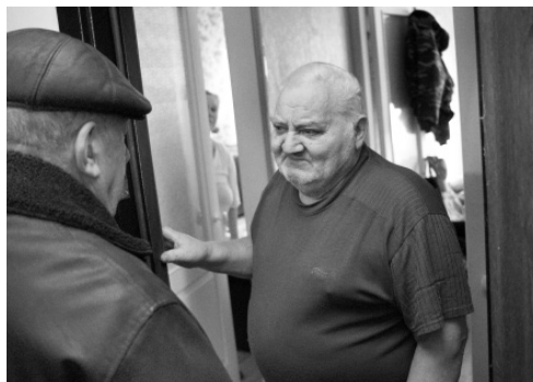
Переселение из аварийного и ветхого жилья — под контролем

— Здесь хорошие и внешний вид домов, и планировка, и состояние подъездов, большие общественные пространства, достаточное количество детских площадок, — поделился впечат-