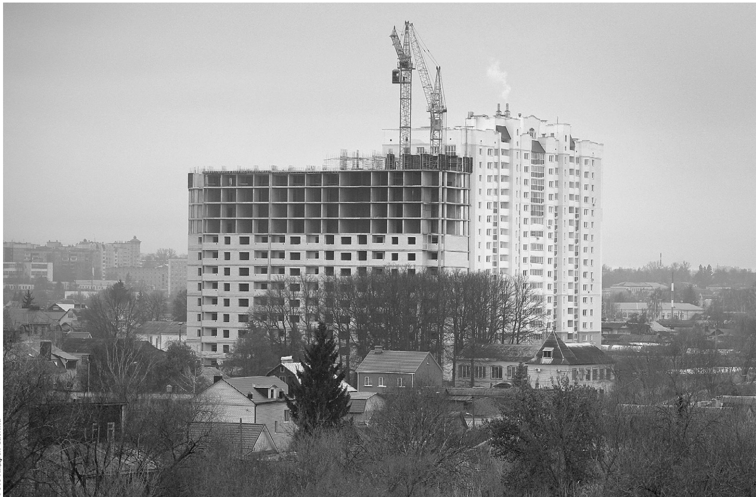
Проблемный дом № 83 на ул. Панчука в Орле