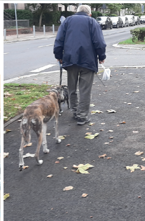
Рейн очень похож на Оку