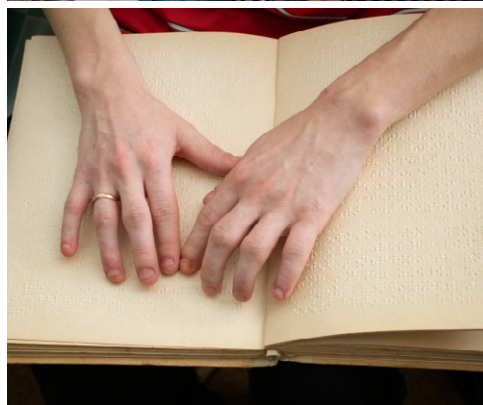
Целый мир — на кончиках пальцев

спросил: «А когда тебе, мама, операцию сделают, чтобы ты всё видела?»