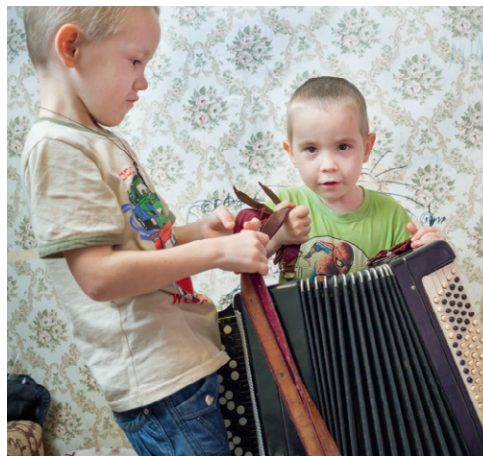
Хотим играть на баяне, как папа