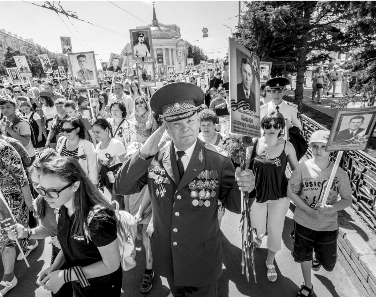
Они должны идти победным строем в любые времена...

Владимир Путин: «Любое очернение подвига народа при защите Отечества будет антиконституционным»