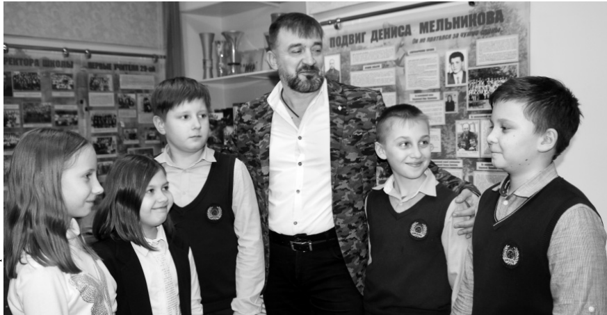
Такие встречи для девочек и мальчишек не проходят даром