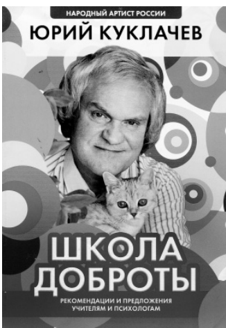
НАРОДНЫЙ АРТИСТ РОССИИ

Сейчас много новомодной литературы на тему воспитания, но в этой маленькой книжке — множество чётко прописанных, проверенных временем и в то же время пропущенных через сердце конкретного, по-настоящему доброго человека и талантливого артиста, которому нет аналогов в мире. Приятный бонус — весёлые упражнения, которые наверняка понравятся детям.