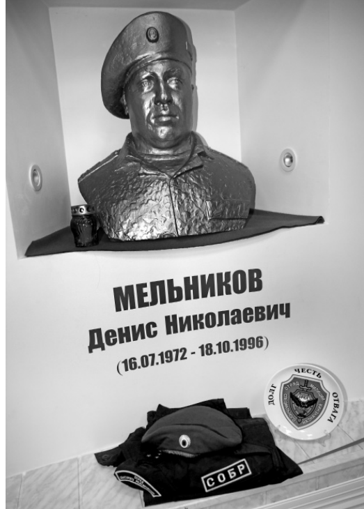
В школе № 29 г. Орла чтят память своего выпускника