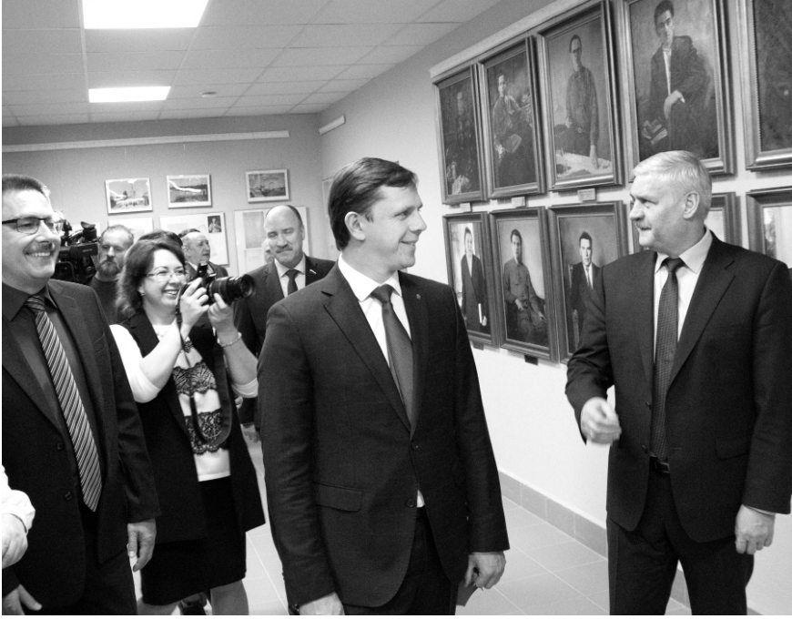
В музее облсуда