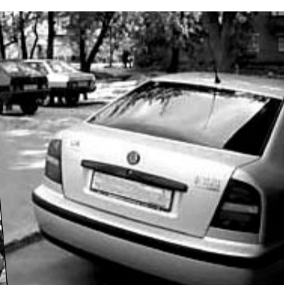
Зад оживленные дебаты в орловском обществе вызвала непривычная тогда идея строительства подземного многоэтажного гаража — кажется, в районе автовокзала. Но... шумная волна, пощекотав какое-то время интерес провинциальных обывателей, ушла в землю. Забылась.