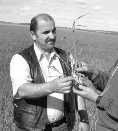
Чтобы окончательно покончить с остатками уравниловки, ввел новый порядок начисления зарплат не за "выход", как раньше, а на основе персонального КТУ (коэффициента трудового участия). Кстати, только в прошлом году средняя месячная плата в расчете на одного работника здесь выросла на 1467 рублей, или более чем в два раза.

Взять прошлый год. Единственный в районе СПК "Русь" преодолел планку жай (на снимке слева направо). Оценка такова: развитие и густота стояния пшеницы — на уровне, так что главный хлеб и в нынешнем году должен дать отменную отдачу.