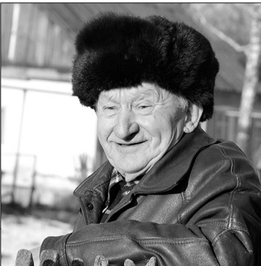
Где-то тут на дне лежит танковый ствол.

«Есаульская», где 9 февраля произошёл взрыв метана, будет затоплен для того, чтобы потушить начавшийся там пожар. Решение о затоплении приняла государственная комиссия после того, как накануне в шахте прозвучал ещё один взрыв.