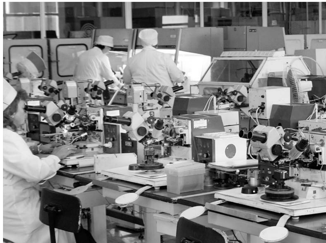
В цехе орловского ОАО «Протон».

(Окончание. Начало на 1-й стр.) Кстати, сейчас в России на самом высоком уровне много говорится о том, что скоро будет принят федеральный закон об энергосбережении, что с 2011 года, возможно, будут запрещены производство и оборот ламп накаливания — в первую очередь мощностью более 100 Вт. Применение энергосберегающих ламп позволит и населению, и промышленному производству сэкономить на оплате электроэнергии. Поэтому для этого орловского предприятия слова В.В. Путина о свете и рассвете на экономическом горизонте имеют самый прямой смысл. Поставки на экспорт стали настоящим локомотивом для выхода из трудной экономической ситуации и для орловского предприятия ПК «Сетчатые изделия». Начало года здесь было тяжелым. Однако в июле-августе, по словам генерального директора В.И. Судони, удалось выйти по объемам производства и реализации продукции на уровень прошлого года. Поставки изделий на экспорт (в Белоруссию, Казахстан, Таджикистан) по сравнению с 2008 г. выросли в 12 (!) раз, что позволило перекрыть отставание первых месяцев года. В ЗАО «ПК «Сетчатые из-