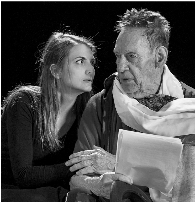
Народный артист РФ Пётр Воробьев отметит свой 75-летний юбилей на сцене

— Сразу после Нового года театр выпустит