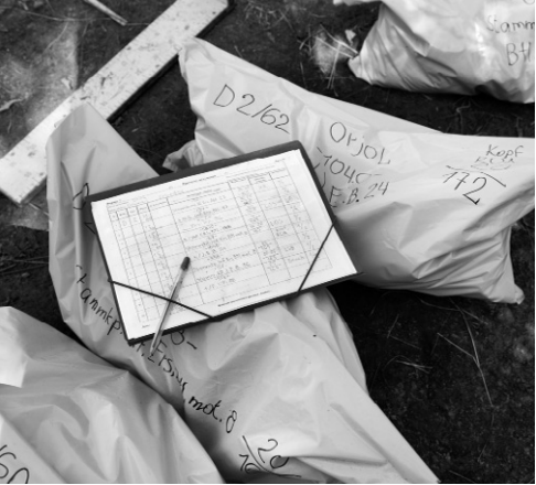
Удаётся определить даже рост каждого военнослужащего

По данным официального сайта Орловского горсовета, впервые запрос о проведении эксгумации останков немецких солдат от ассоциации «Военные мемориалы» поступил к депутатам горсовета ещё