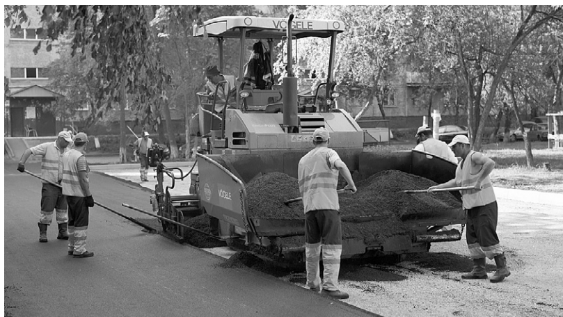
Пока из 77 дворов в Орле отремонтировано только 28

— Мы получили деньги в декабре, вошли в программу, а конкурсы провели только в мае-июне. Чуть раньше мы можем сделать это в 2018 году, чтобы у нас