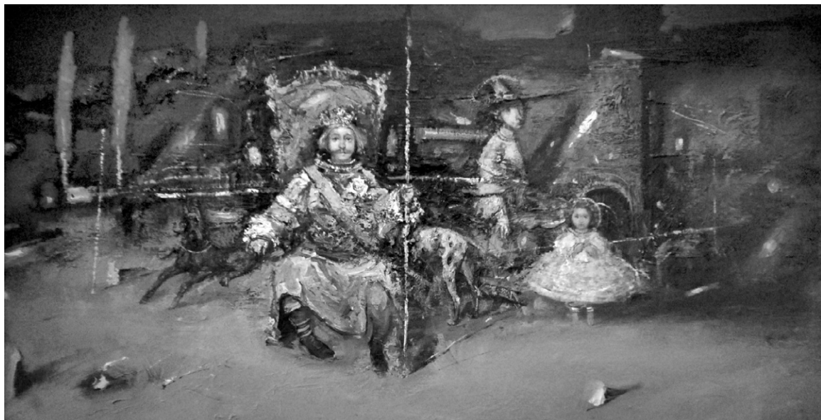
«Король и шут». 2006 г.