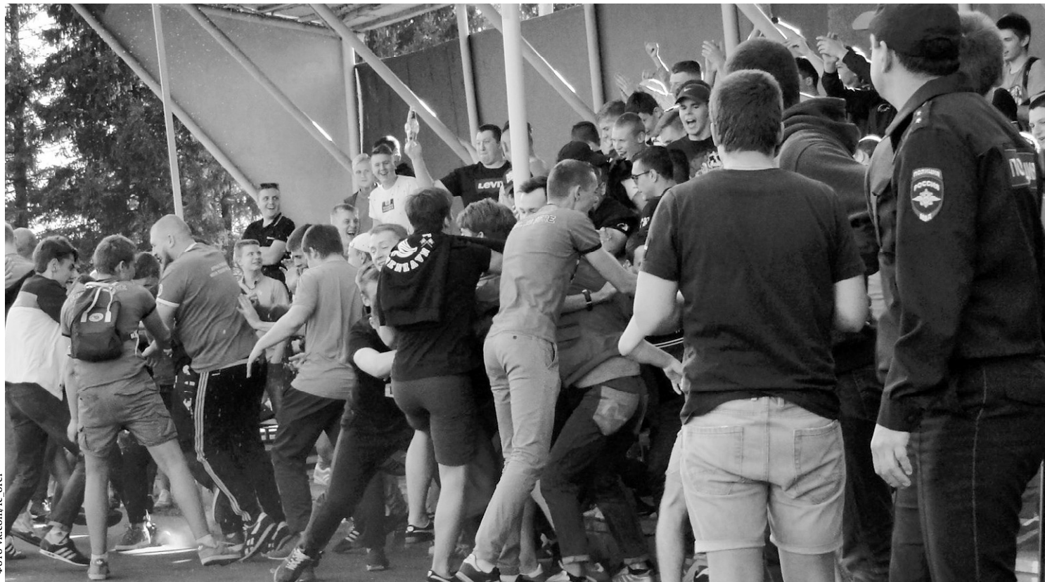
Болельщики футбольного клуба «Орёл» на стадионе «Олимпия» в Болхове

Но члены КДК не поверили представителям «Орла» и, ссылаясь на рапорты арбитров, свидетельства очевидцев, фото и видеозаписи, пришли к выводу, что выбежавшие