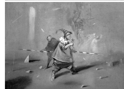
«Белый ангел». 2015 г.

вил Анатолия Костяникова с недавней победой на III открытом Белгородском фестивале изобразительных искусств памяти заслуженного художника России Станислава Косенкова, где художник представил свою картину «Икар». Александр Бударин пообещал представить эту картину орловским зрителям, после её возвращения с выставки в Белгороде.