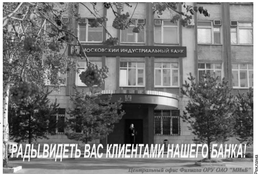
Реклама Центральный офис Филиала ОРУ ОАО "МИБ"

ПРИСУТВИЕ НА АКЦИИ ЯВЛЯЕТСЯ ОБЯЗАТЕЛЬНЫМ УСЛОВИЕМ. ЖЕЛАЕМ УДАЧИ!