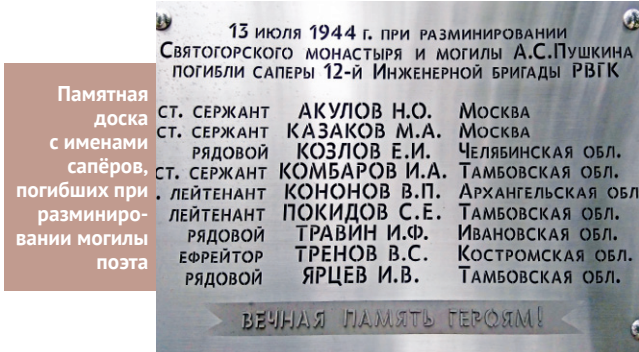
Памятная доска с именами сапёров, погибших при разминировании могилы поэта

приезжал за несколько месяцев до своей гибели — в 1836 году умерла его мать, Надежда Осиповна; согласно её воле она похоронена именно при этом монастыре.