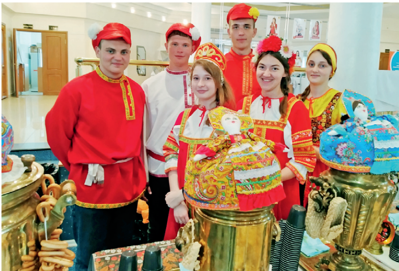
Дефиле в народных костюмах