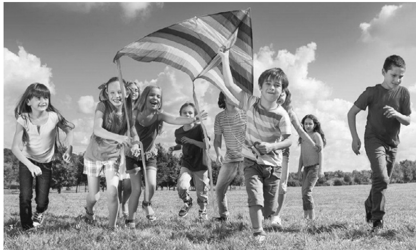
Лето — это маленькая жизнь

Во всех лагерях круглосуточно будет находиться медицинский работник. Все сотрудники заранее прошли необходимые анализы, в том числе тест на COVID-19. Планы воспитательной работы составлены таким образом, что-