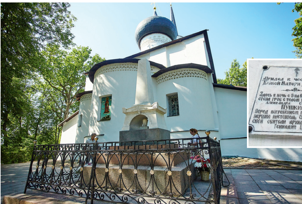
Могила А. С. Пушкина у алтарной стены Святогорского монастыря

Известно, что последним земным приютом великого поэта стал древний Святогорский монастырь. Сюда Пушкин