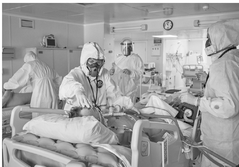
Врачи реанимации борются за жизнь каждого пациента