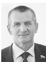
и лекарственное обеспечение — это те проблемы, которые требуют от нас неотложных решений.