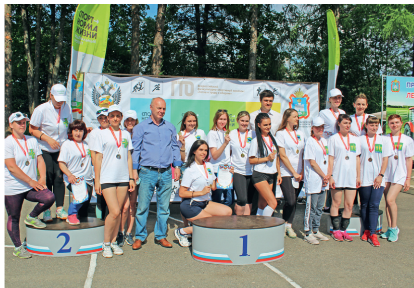
Позади — трудный путь к пьедесталу

В соревнованиях, собравших на глазуновской земле лучшие