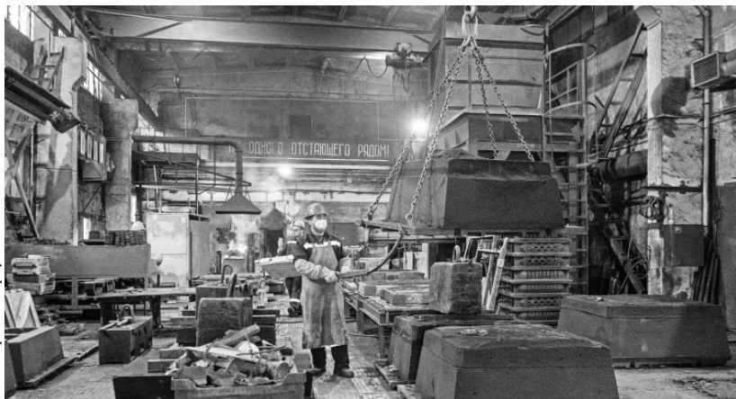
Участок, где чугуны получают из стали